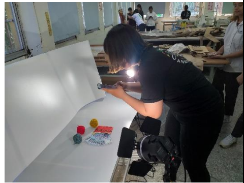
家政領域—縫紉技巧與袋包成型