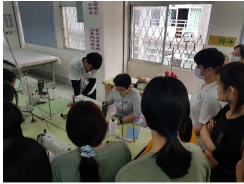
體育領域—整個運動場都是我的伸展台