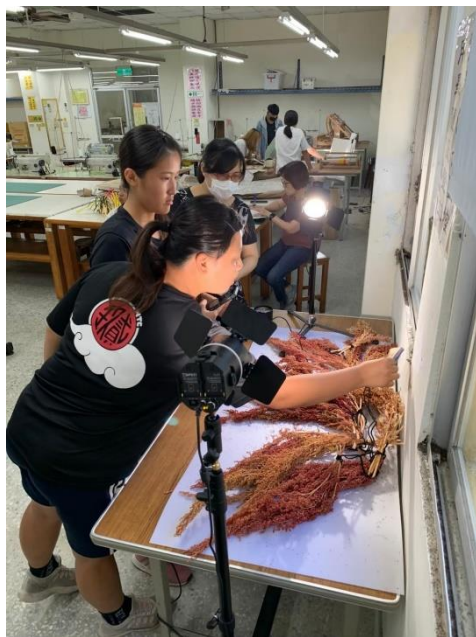
數學領域—商品的成本計算