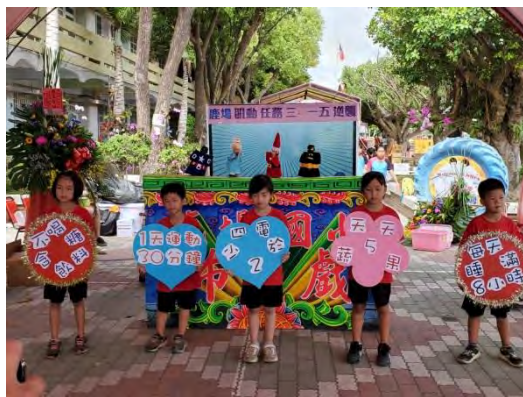
好戲登場~肌動任務三-一五逆襲