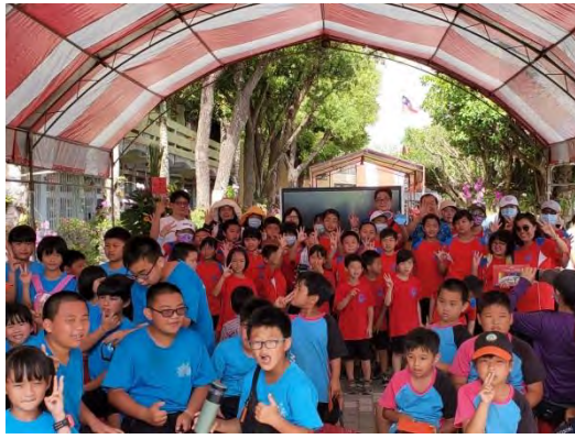
期末成果展-演出成功