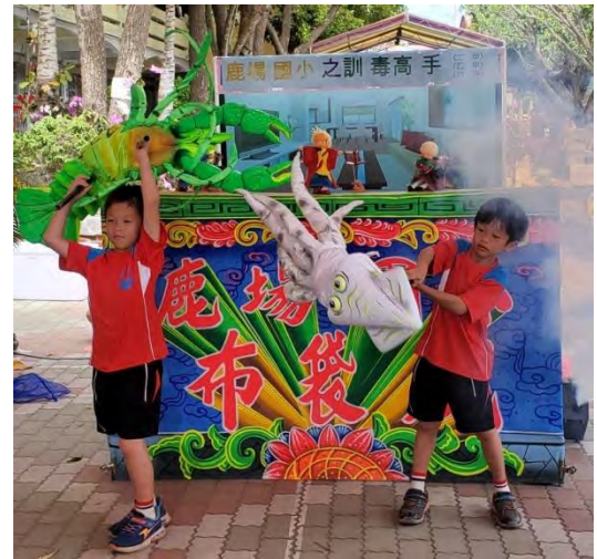
好戲登場~訓毒高手