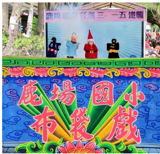
好戲登場~肌動任務三-一五逆襲