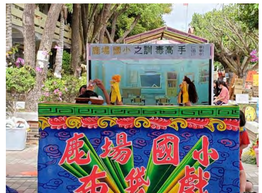
好戲登場~訓毒高手