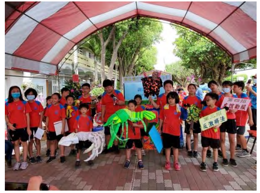
期末成果展-演出成功