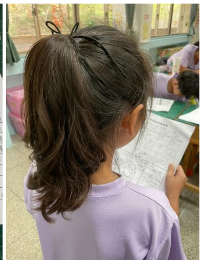
學生完成日常寫作，並摘要進行口頭發表。