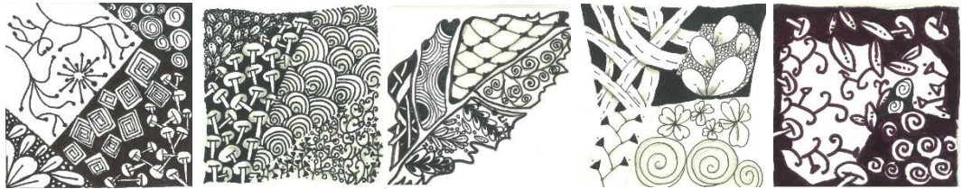
學生運用植物紋理，完成繽紛多樣的纏繞畫作品。