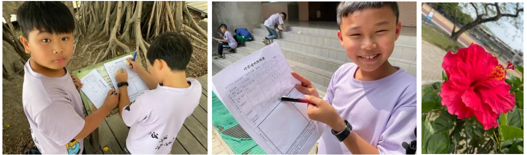
學生觀察校園植物，並完成「校園植物點線面」學習單。