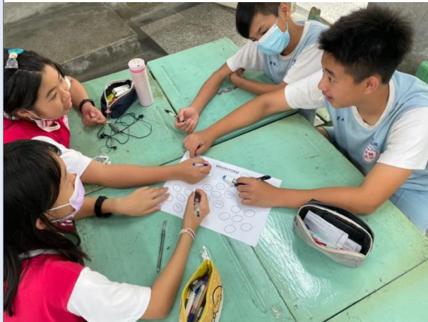
透過腦力激盪，引導學生從各組攝影作品去發散詞句