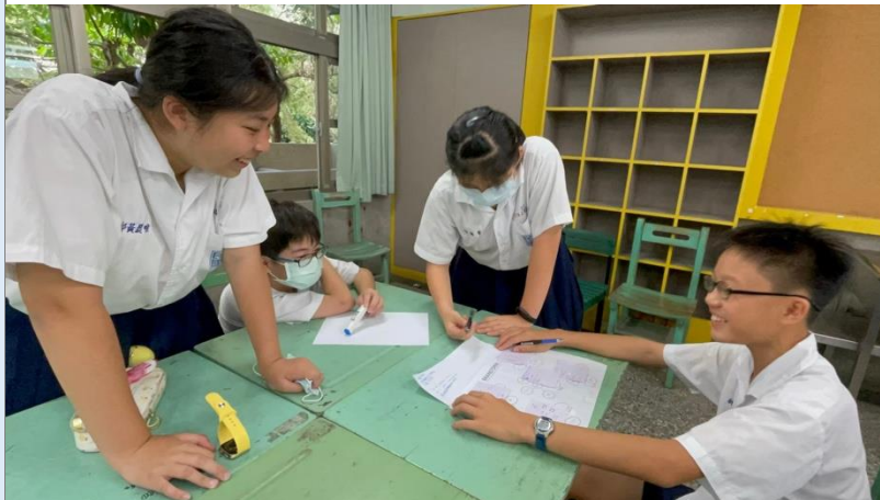
透過小組合作，運用英文俳句，將地景攝影之作品之詮釋，因著文具有了不同的感受與發現。