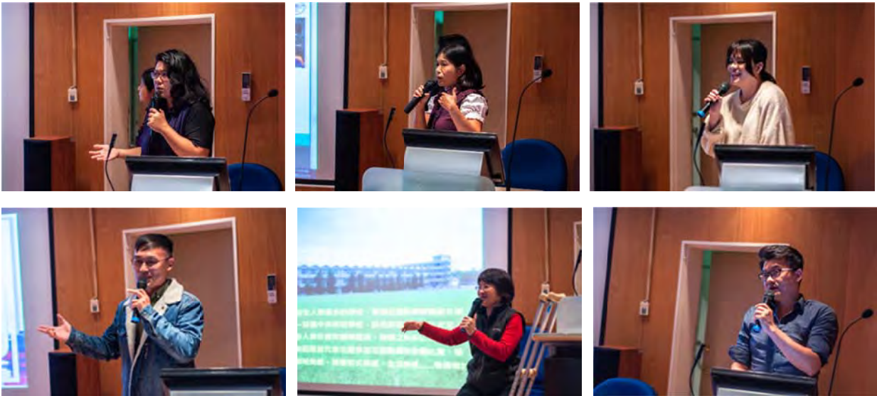
花蓮地區種子教師分享跨領域課程與教學案例