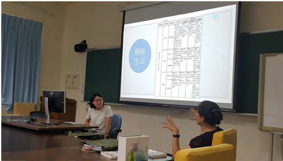
藝術教育課程：教授指導師培生探討十二年國教課綱和研發課程方案

師資生之學習成效主要有三：1. 藉由課程參與與相關增能活動，培育跨領域美感教育素養，2. 具有編撰跨領域美感教材和研發跨領域美感課程方案的能力，3. 公開發表跨領域美感課程方案。