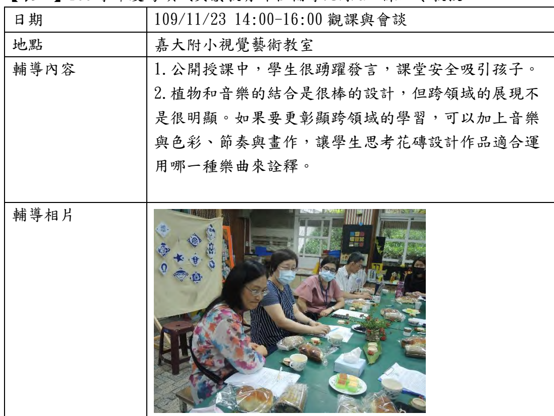
【表一】109 學年度跨領域美感教育課程輔導紀錄 a 陳虹苓教授