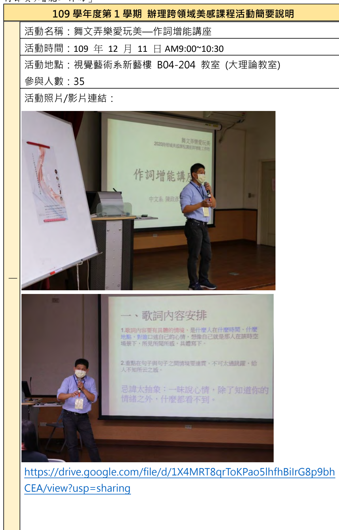
【表三】109 學年度第 1 學期「舞文弄樂愛玩美—作詞增能講座」&「作樂(流行節奏)增能工作坊」