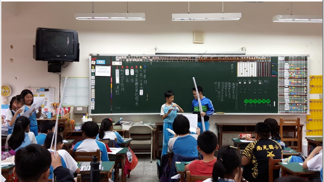
↑ 分組演出各段的情境劇