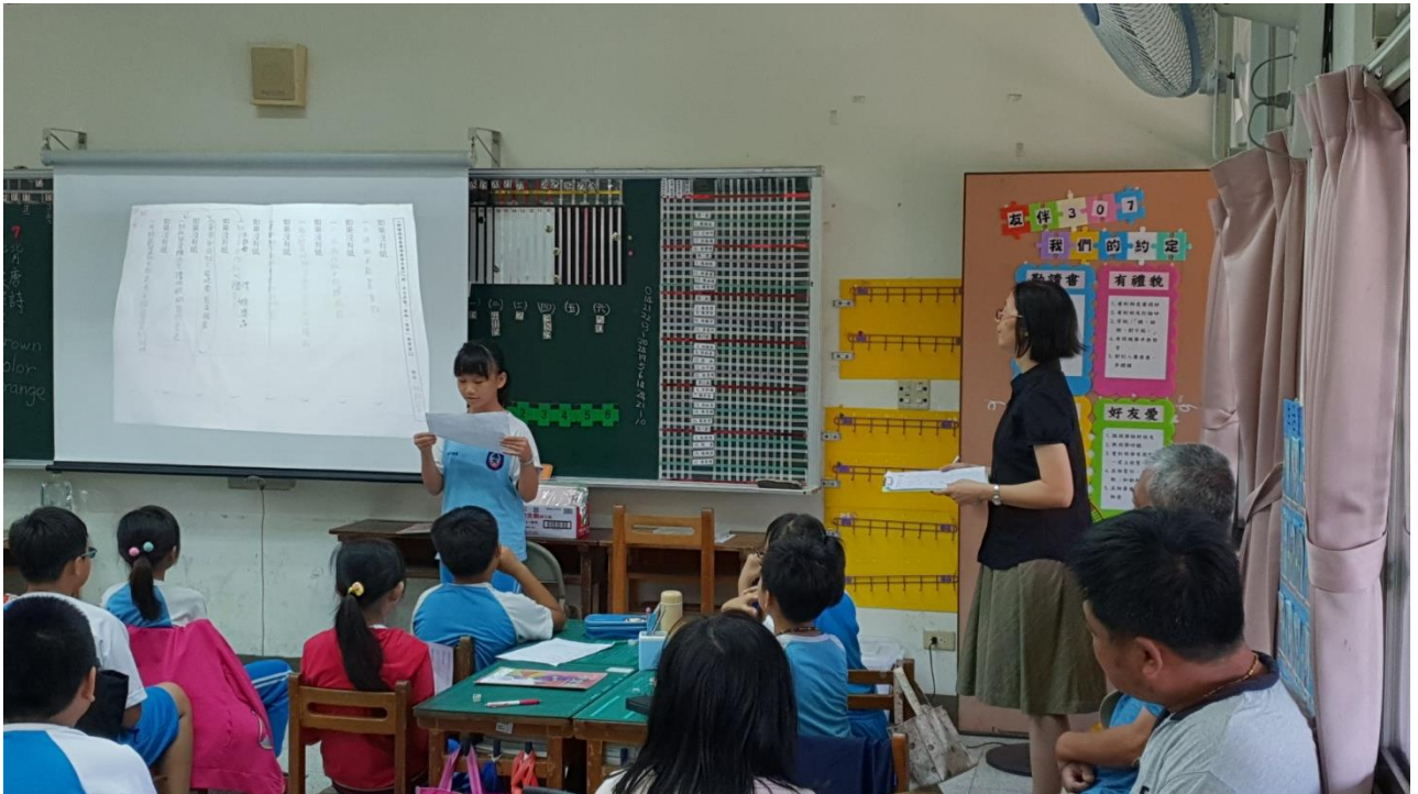
↑ 學生童詩作品發表