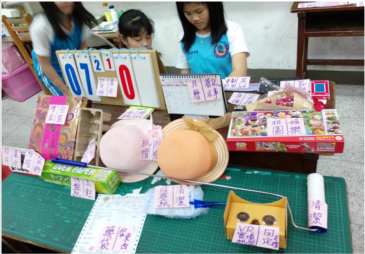
↑ 小組使用便利貼做整理，標示產品名稱和用途