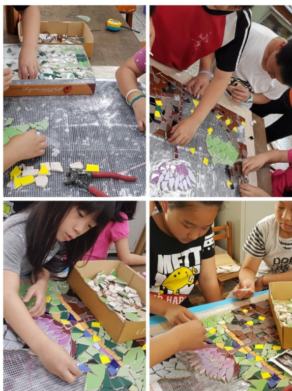
第一階段 馬賽克拼貼完成