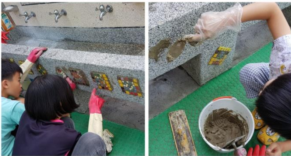
認識材質的運用 水泥黏貼牆面