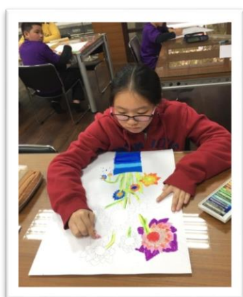
大膽用色、努力作畫