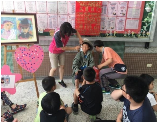
我們一起來裝扮成梵谷