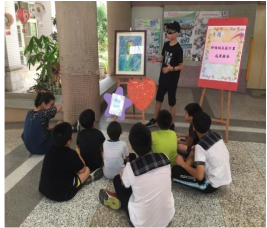
分組導覽解說活動