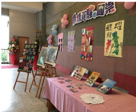
畢業畫展---畫作展示、學生作品集、明信片