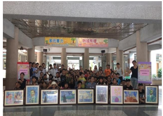
導覽結束全體大合照