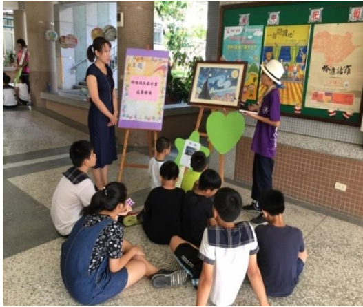
分組導覽解說活動