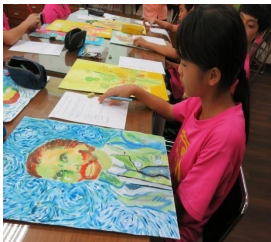
完成導覽稿學習單