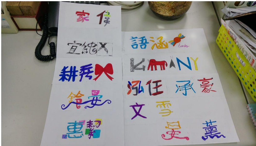
6.小朋友名字設計平面稿