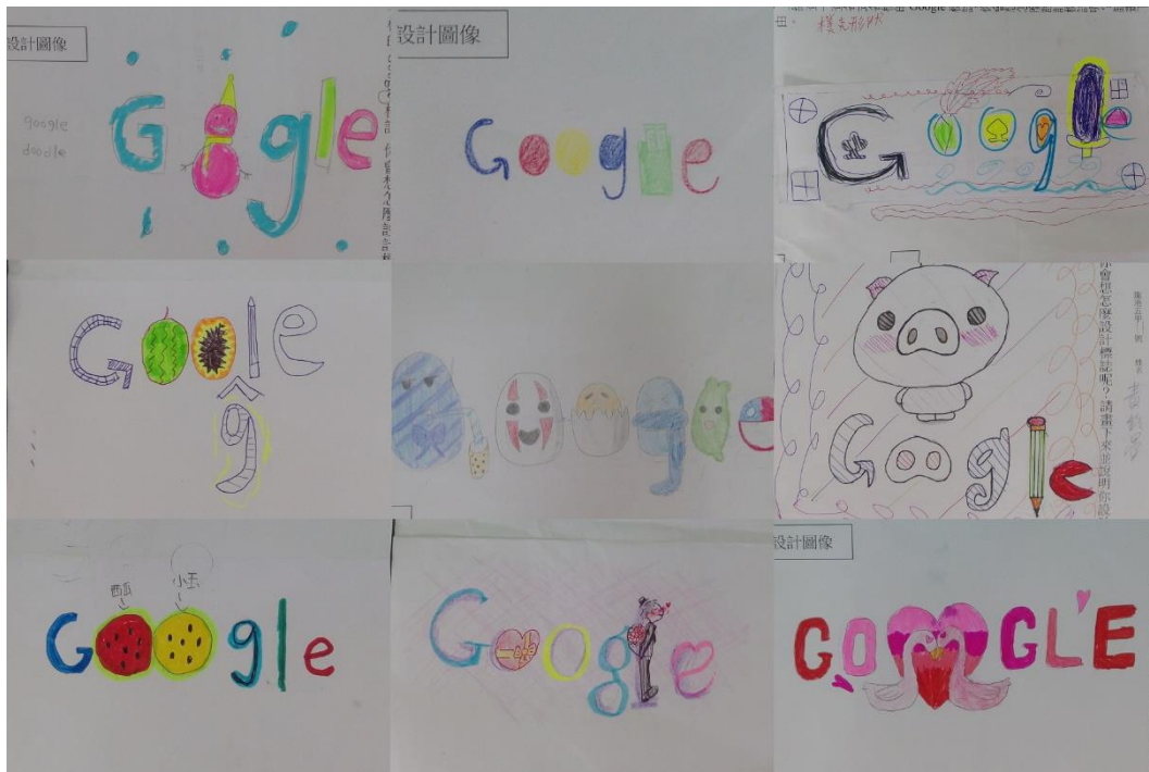
4.小朋友設計的 Google 標誌