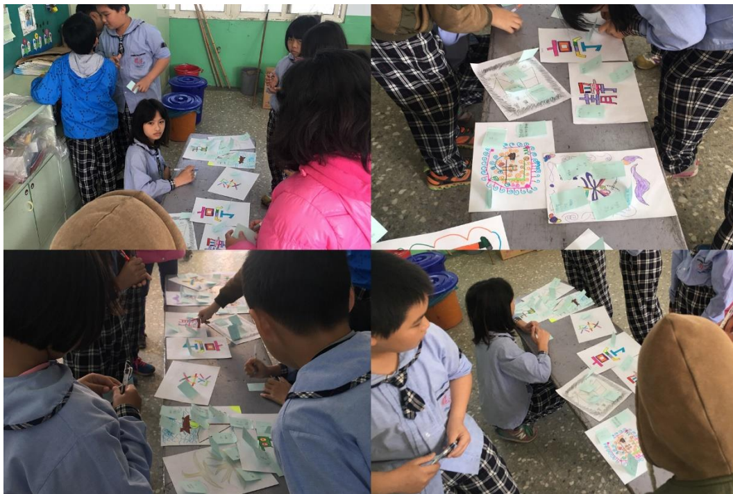
5.小朋友正在票選喜愛的設計