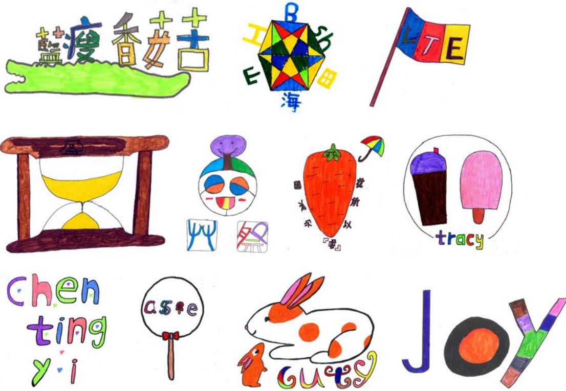
8. 小朋友設計自己的 LOGO