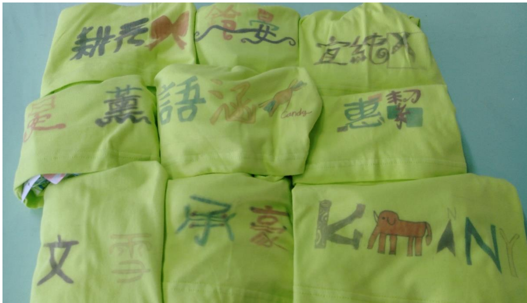
9. 小朋友設計獨一無二的標誌轉印至 T 恤上