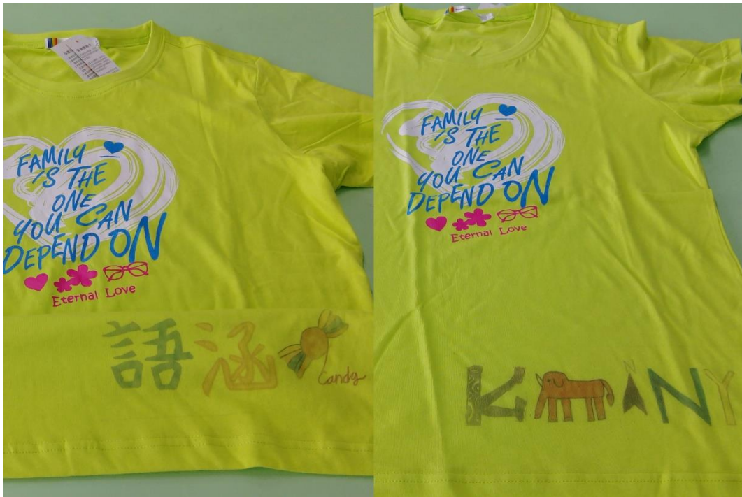
7.小朋友中英文名字標誌