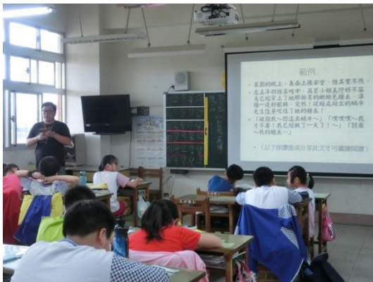
引導如何創作劇本。