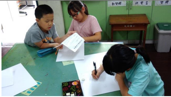
分組討論劇本與角色造型