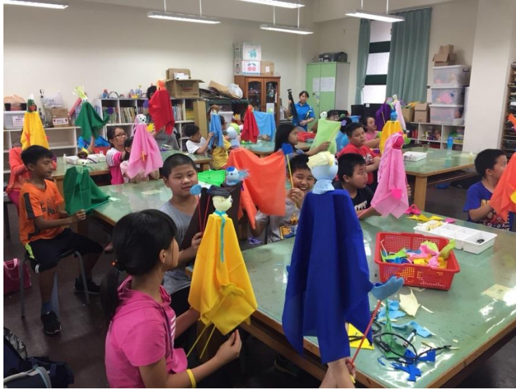
學生完成自己的杖頭偶