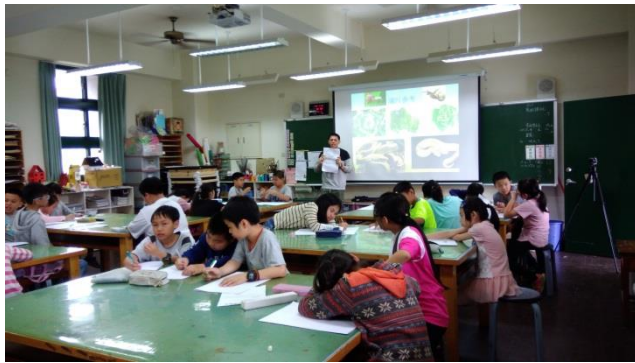
教師示範如何設計角色造型