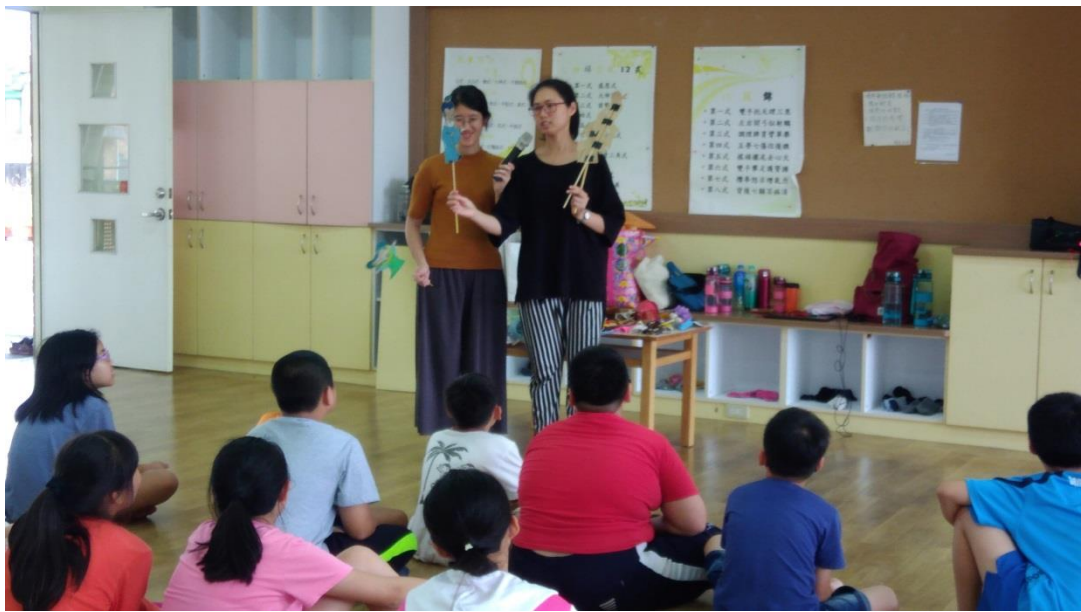
偶戲老師示範各種戲偶