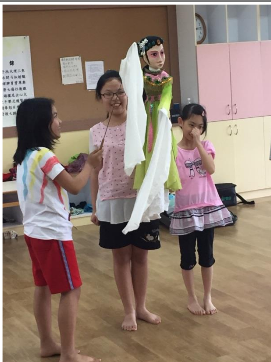
學生能合作練習操作戲偶