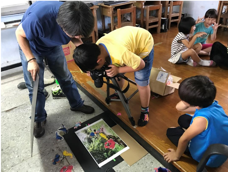
7. 當一組進行拍攝工作時，另一組在討論分工與檢視拍攝內容，重新分配位置與打光。