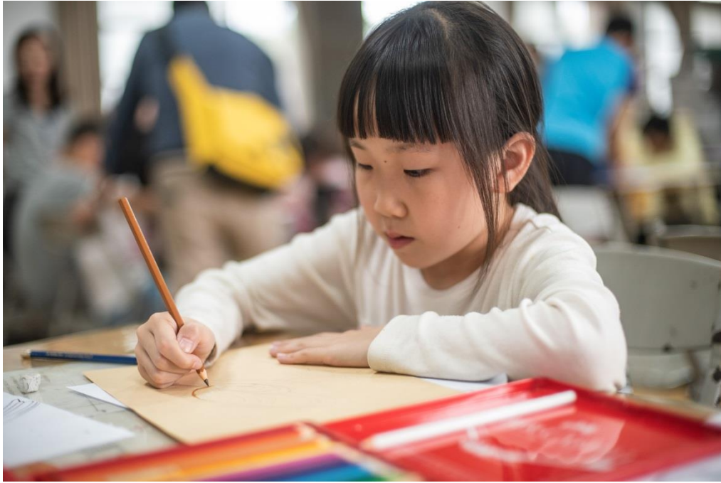
2.一年級的學生認真的繪製人物的靜態構想草稿