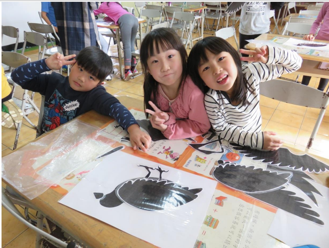
5.學生利用肢體的拆解片，討論如何製作動態的人物。