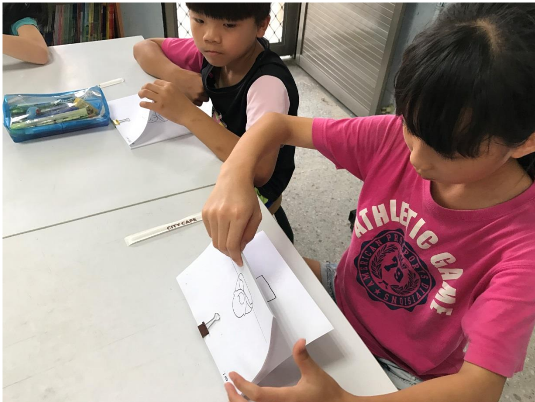
4.經過老師的協助將人物轉為分鏡實線稿後，學生正在翻閱檢查各組的人物製作並進行分工的討論。