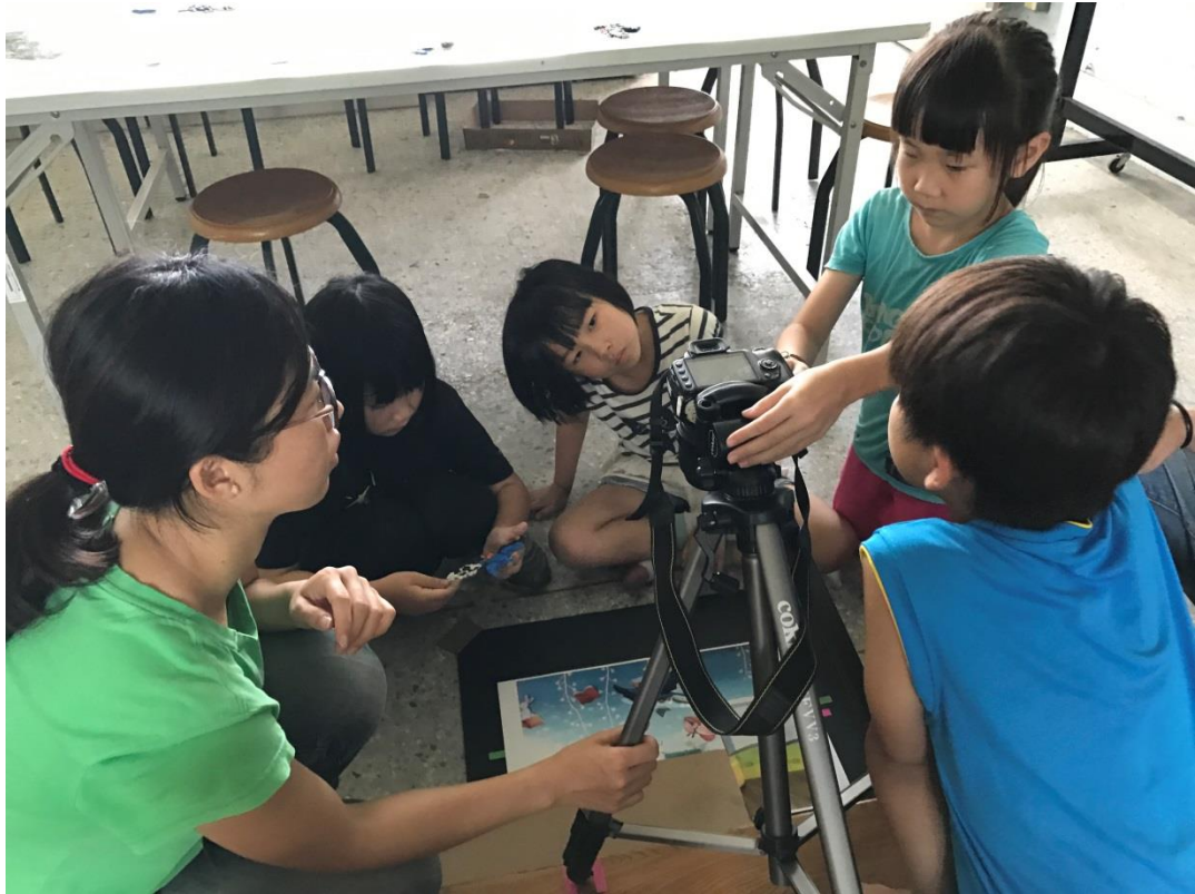
8.經過多次試拍不成功後，小朋友對工作的態度轉為嚴謹，對拍攝細節更加注意了。