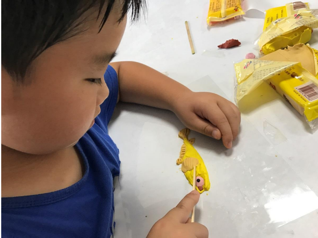
6. 學生認真地投入情感，用心製作場景裡人物的細節。