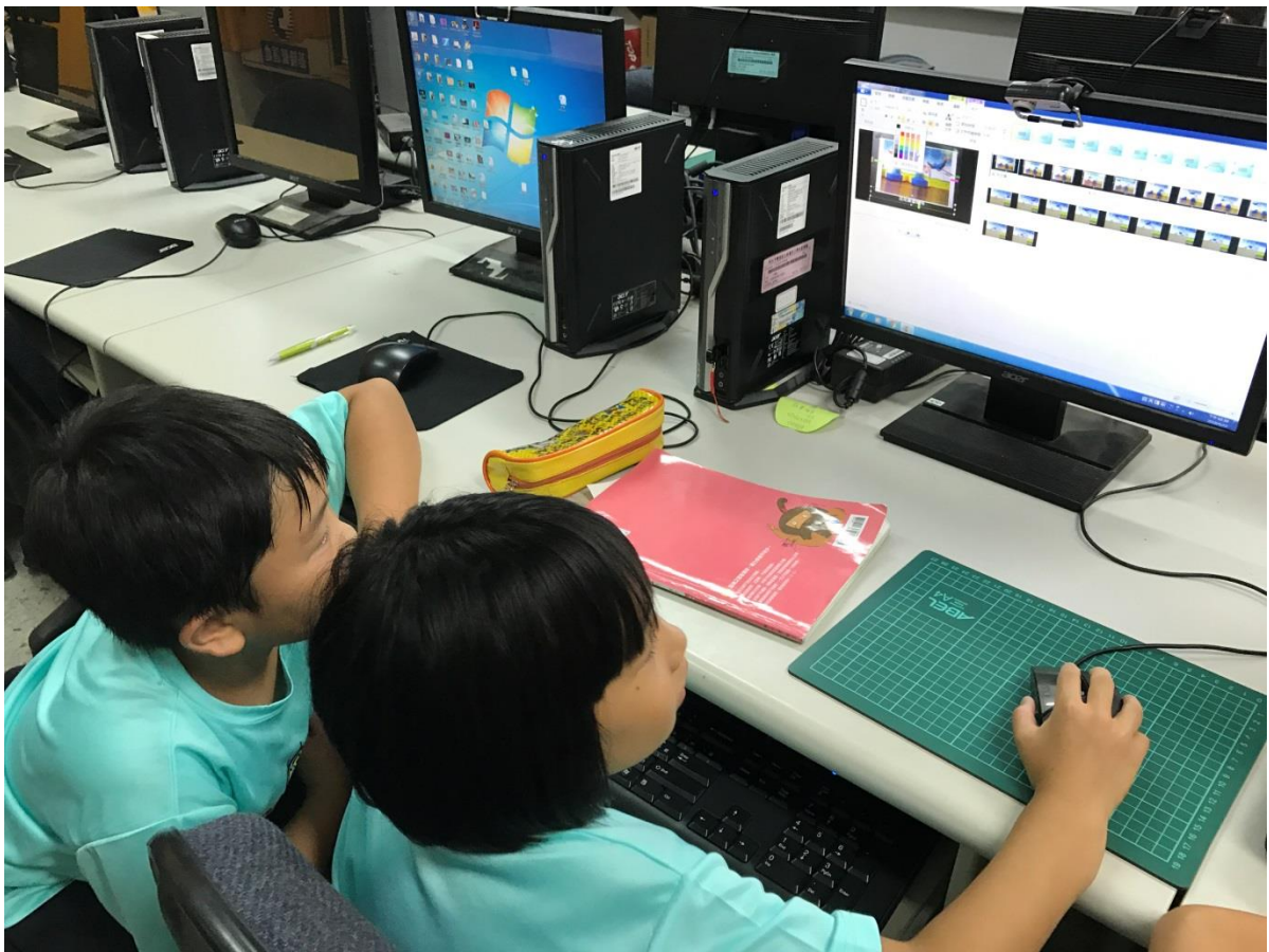
9.學生看著分格認真討論要上什麼字幕。對於注音打字仍然需要較長的時間練習才能打出流暢的語句。