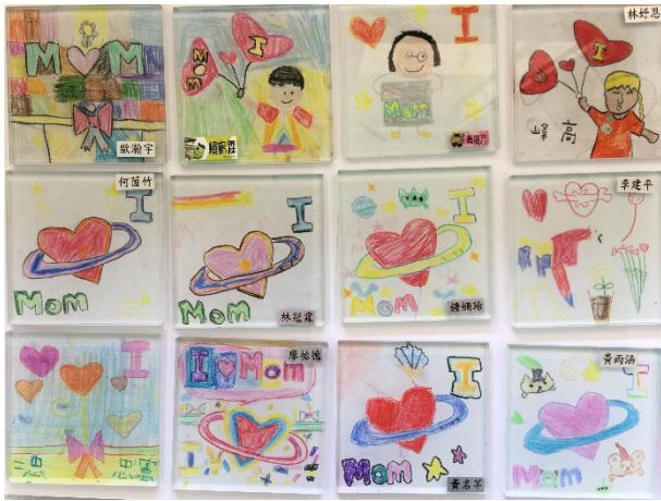
彩繪玻璃杯墊成品