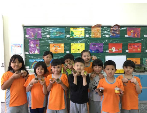
開心的展示果凍成品