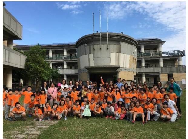
二年級學年野餐活動大合照