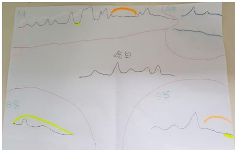
以樂句段落分析為主