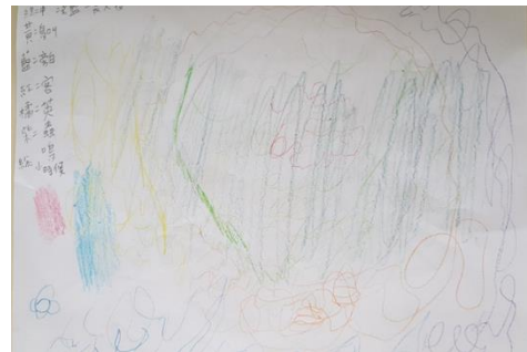
以聲響結合色彩為主