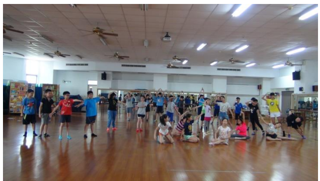
以音畫樂意境為主