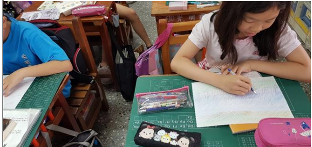
給桐花的信~ 樂句分析與音畫