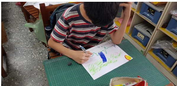
給桐花的信~ 樂句分析與音畫