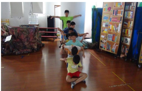
音畫曲式 A 段