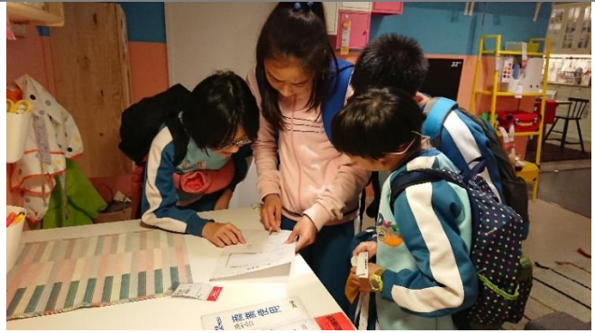
IKEA 小組尋找色彩闖關活動