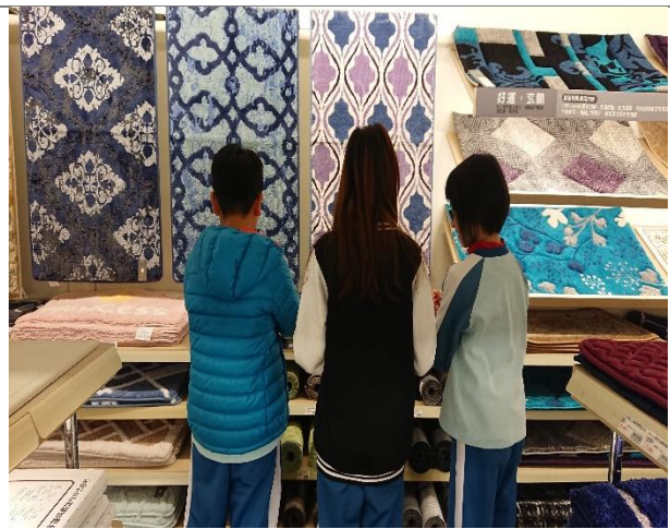
居家美感紋樣觀察