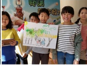
唐詩樂逃逃-視覺挑戰-詩中有畫