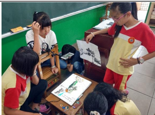
詩中有畫-偶動唐詩