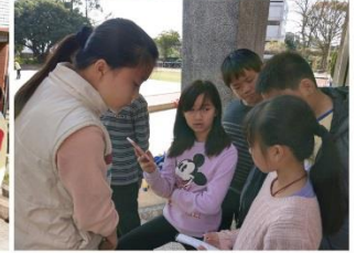
唐詩樂逃逃-音樂挑戰-詩中有歌