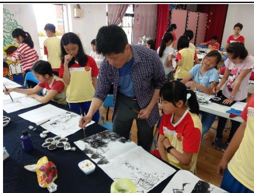
詩中有畫-揮毫話客至