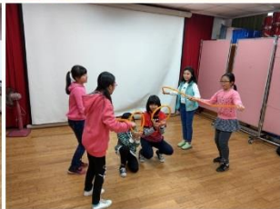
唐詩樂逃逃-表藝挑戰-舞動唐詩