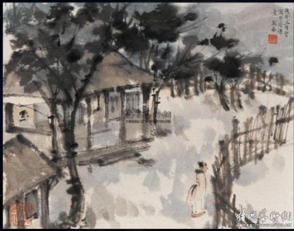
藝術樂逃逃-尋找詩聖