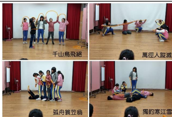
創意水管秀-舞動唐詩