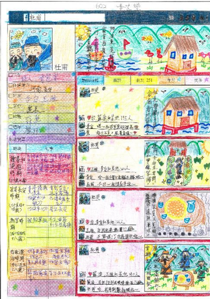
【如果杜甫有臉書學習單】