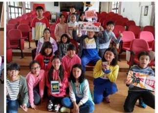
唐詩樂逃逃-解謎挑戰