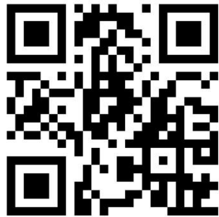
遊戲 QR Code