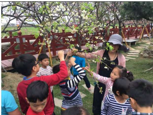
★五感體驗：透過五感加深對大自然的認識。