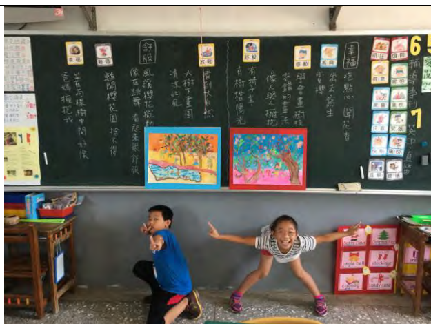
★情緒感受：了解自己的情緒並結合具體的例子，化為短文後，再進行童詩創作。