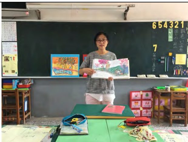
★繪本導入：透過繪本訴說的情感面，引起孩子共鳴，再進行自己畫作內容的抒發。