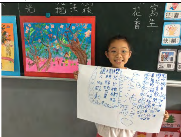
★童詩創作：有了短文的初步構想，讓孩子縮短語句，老師引導抽換字詞讓童詩更加有趣，感覺不同文字的差異與美感。