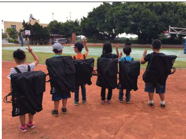
★寫生趣：揹著創作的行囊出發！