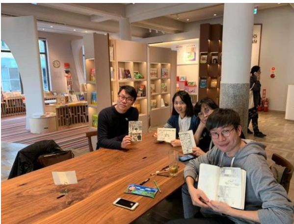
討論初步的跨領域課程合作模式