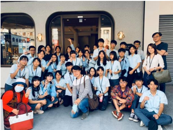
由歷史導師帶隊前往中央書局進行實地踏查