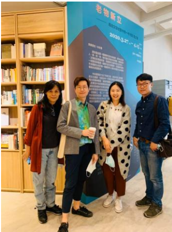
核心教師於中央書局展場合影