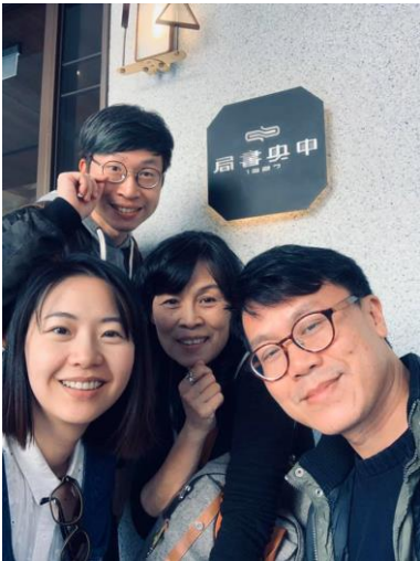
美術教師團隊第一次於中央書局進行現地共備