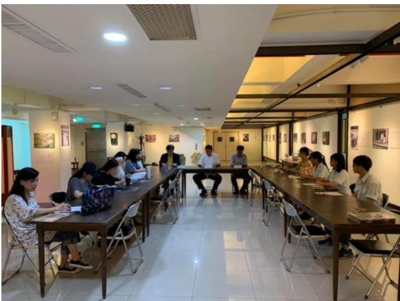
校長帶領一級主管進行跨領域課程發表會