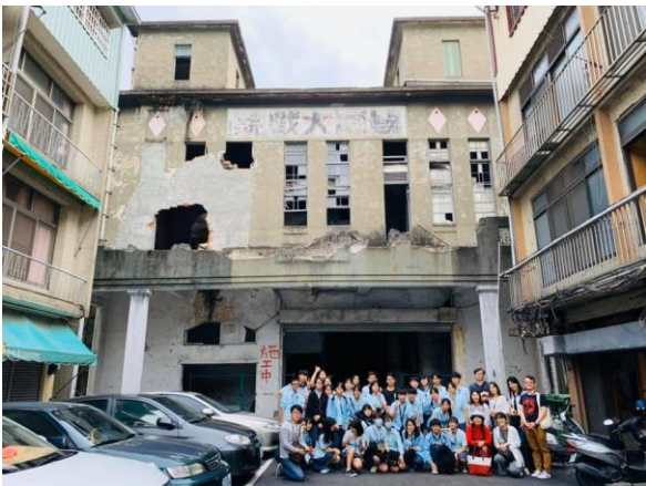
由繁營運長帶隊至附近文學地景走讀及導覽