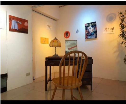
台中一中藝術中心展出現場照