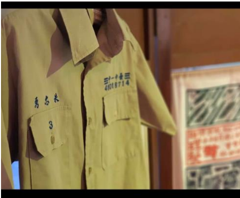
台中一中藝術中心展出現場照