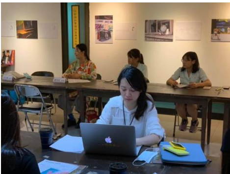
同步進行「老物新立」展覽記者發布會