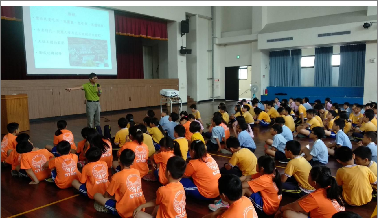
聽聽對在地文化深究的老師說道卡斯的故事