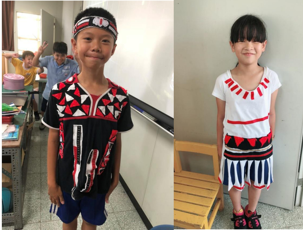
每個孩子設計出自己獨一無二的服裝，我們看見來子的笑容與成就感