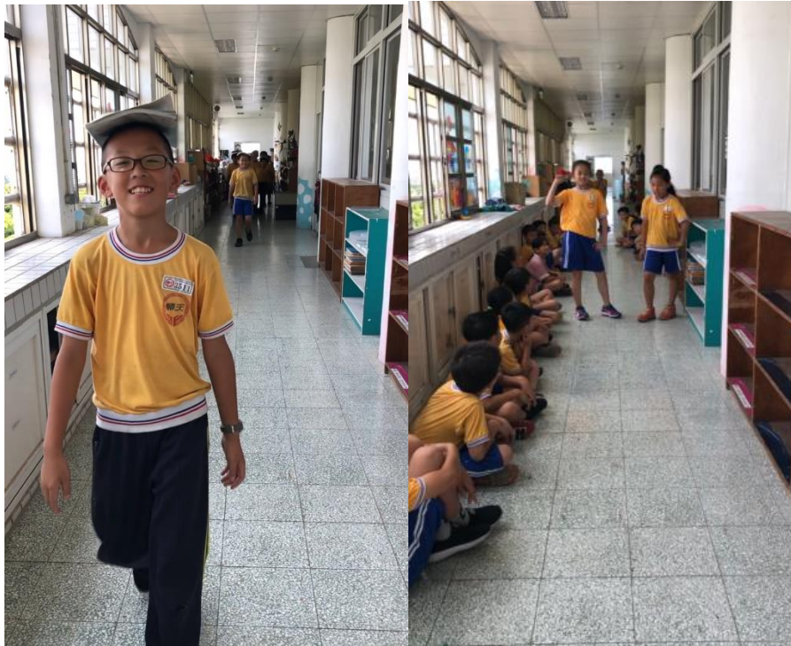
我是小小模特兒—藉由觀察國內外模特兒的走秀，練習自己的走路儀態。第一步就是要抬頭挺胸，不能讓課本掉下來喔！還有定點 POSE 也是要有氣勢的唷！