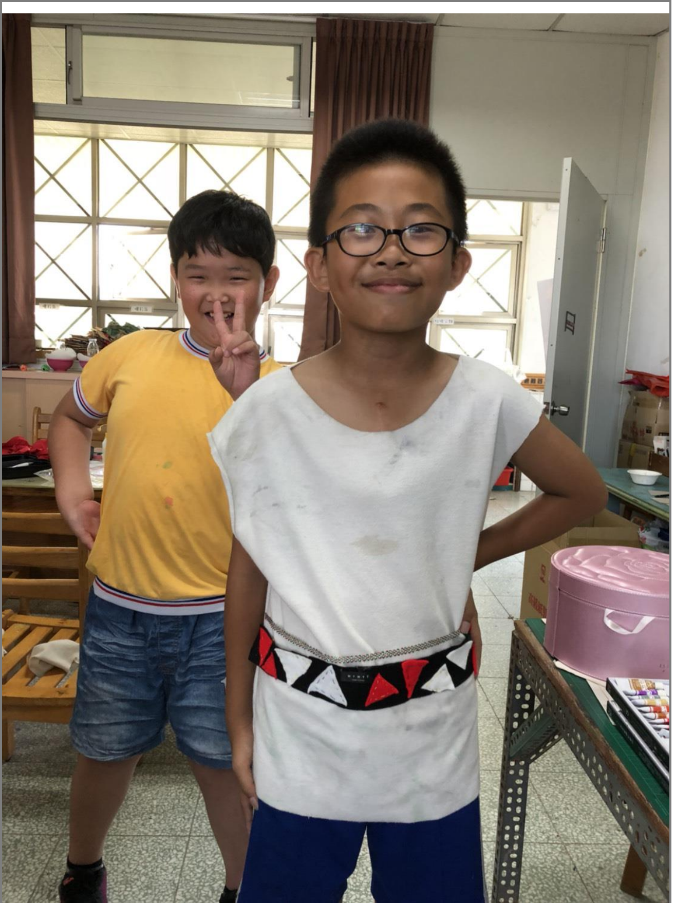
對於繪畫興趣薄弱的孩子，卻在此課程中，提高學習興趣