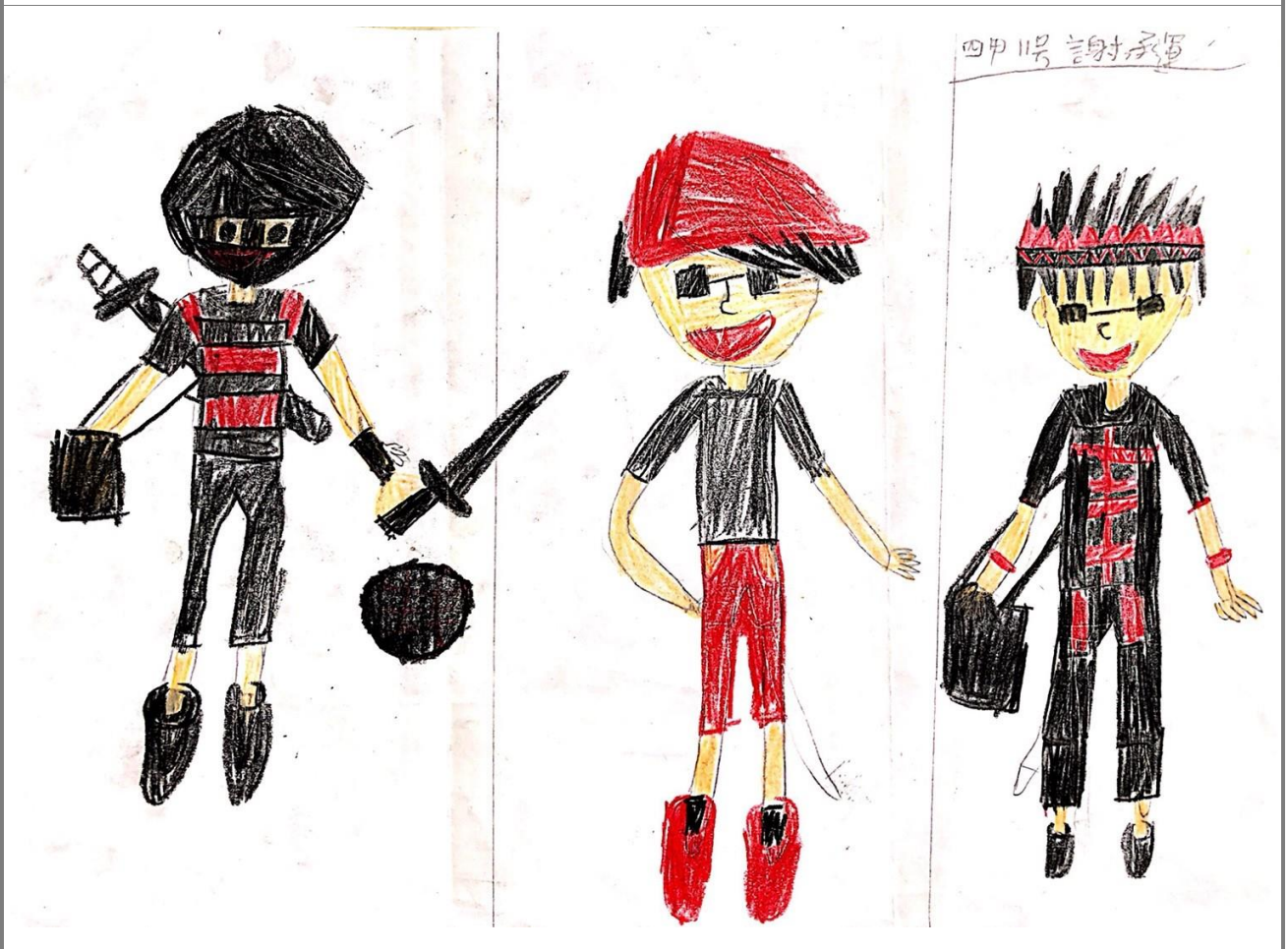
小小服裝設計師—孩子們根據道卡斯族文化結合現代服飾設計出的服裝設計圖