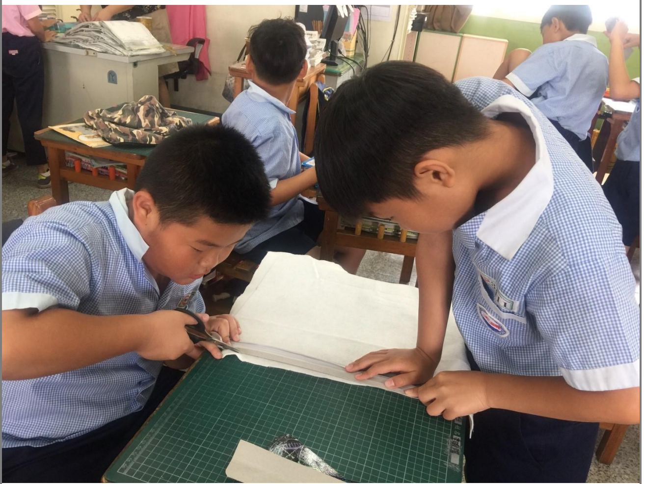
組員間共同合作設計服裝草稿