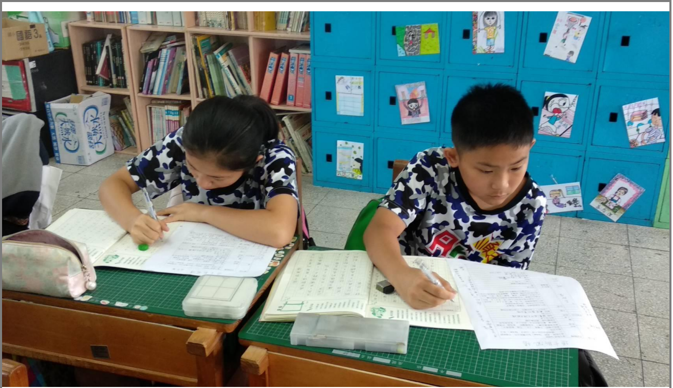
學生書寫；結合學校藝文寫作日，將道卡斯所聽所聞與所見，藉由文字記錄下來。