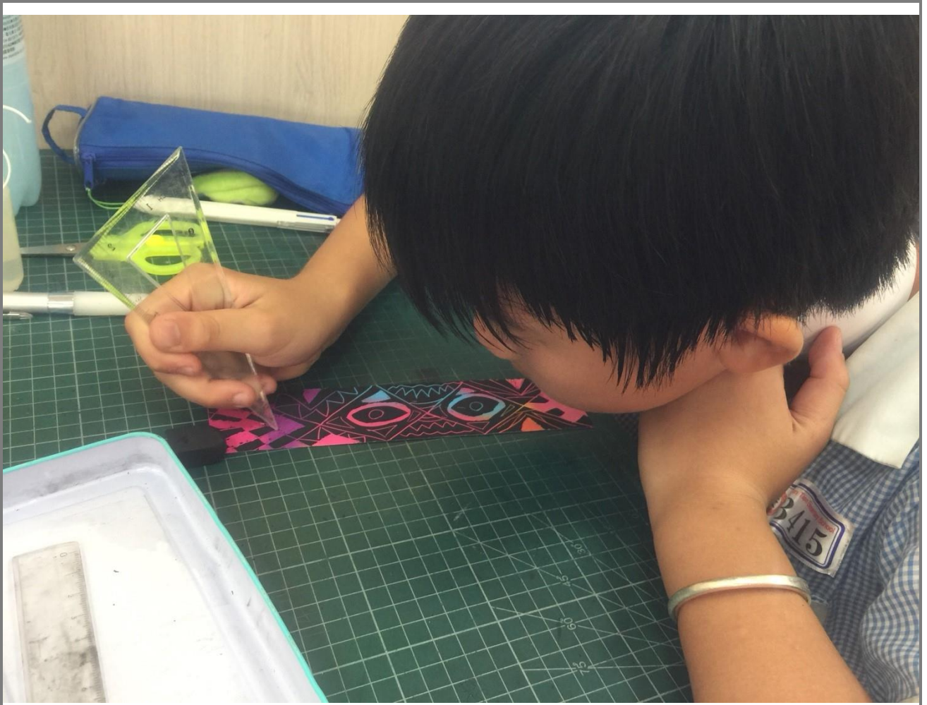
平常活潑的孩子，在這次的課程中，顯得專注投入