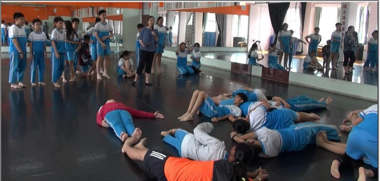
用身體排生字呈現觀摩