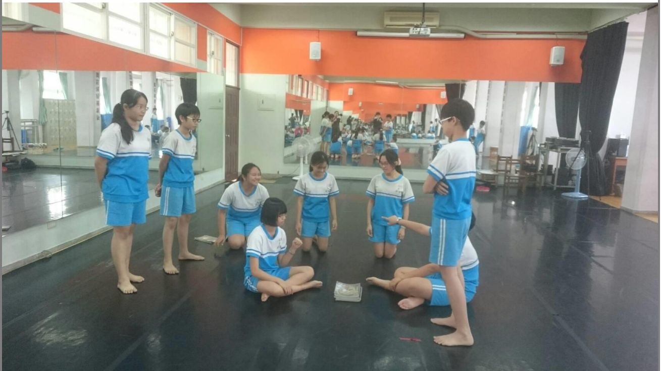
停格的畫面練習照