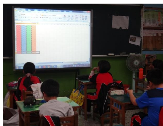
用 excel 畫出設計圖