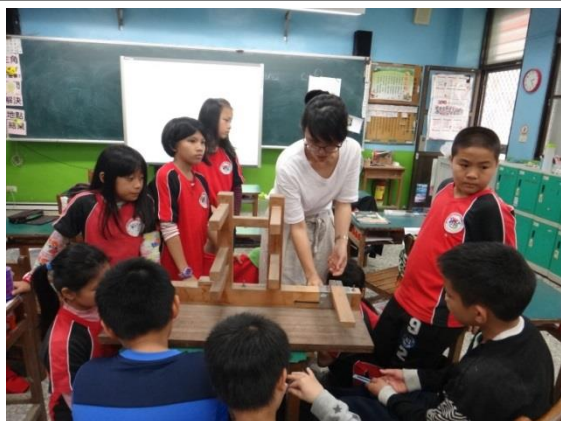
認識桌上型織布機