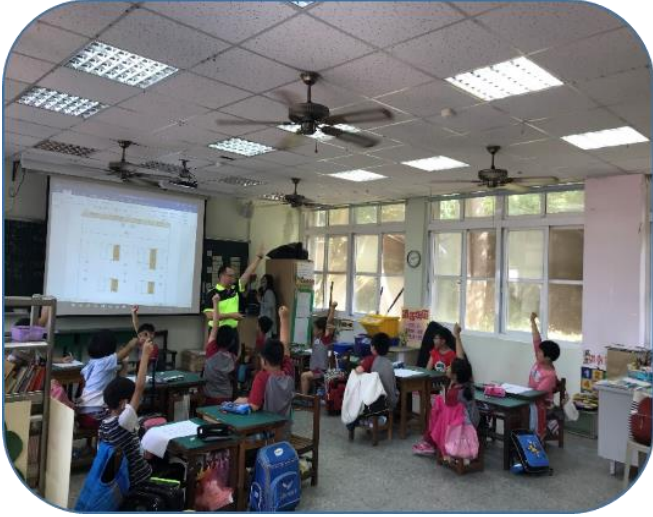
說明：校園尋寶趣-團體討論班級物品的位置