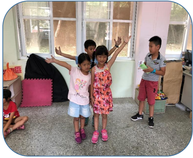
說明：芒果小劇場「開麥拉！」~運用想像力和團隊默契，表演一段「芒果情境劇」。