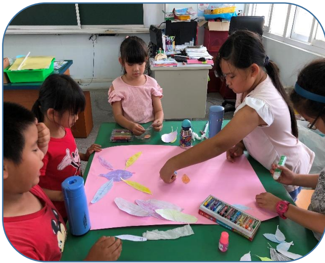
說明：樹葉拓印拼貼畫~將拓印好的彩色樹葉排列成一幅圖畫