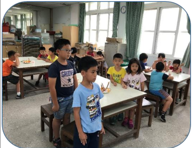
說明：「冰」紛芒果樂園-發表創作理念