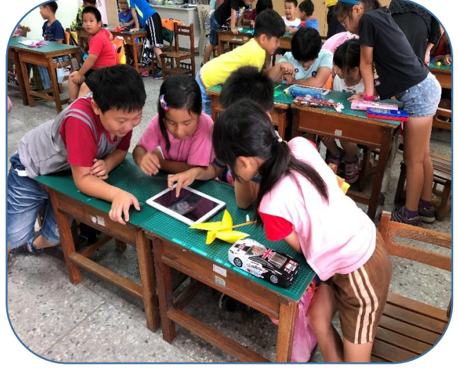
說明：樹爺爺攝影展~分組練習使用平板拍照