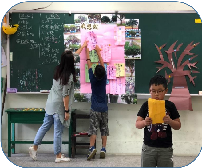
說明：樹爺爺我想對你說~上台朗誦想對芒果樹爺爺說的話。