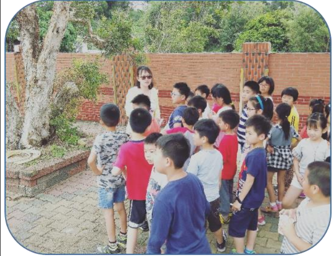
說明：樹木對對碰-校園植物實地踏查