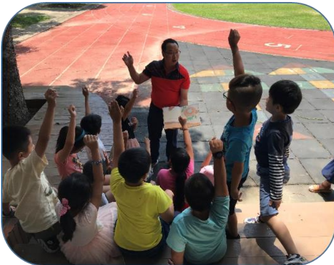
說明：與樹有約-大樹之歌繪本導讀