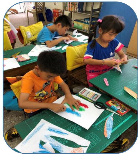
說明：樹葉拓印~用蠟筆或彩色鉛筆拓印樹葉