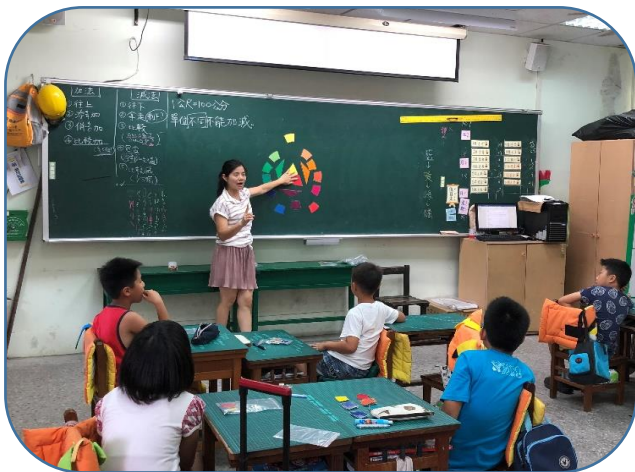
說明：繽紛的色彩~歸納色彩的分類