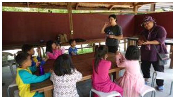
介紹老師與引起動機