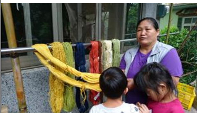
介紹苧麻好朋友的威力-染出不同顏色