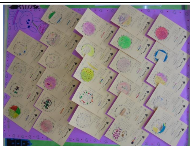
低年級學生聽完展演的回饋