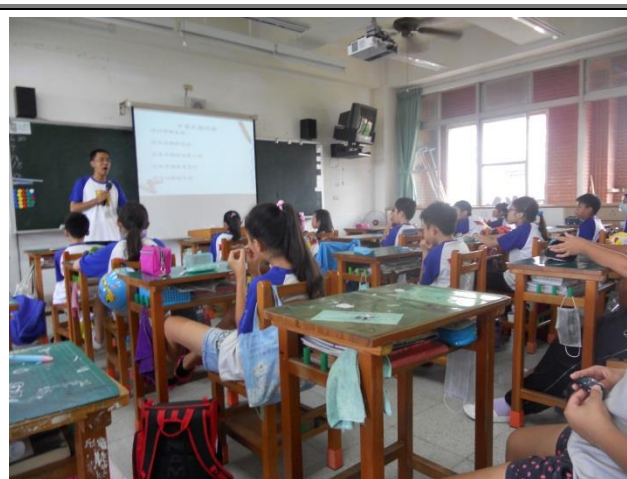
進行臺灣軌道未來展望探討