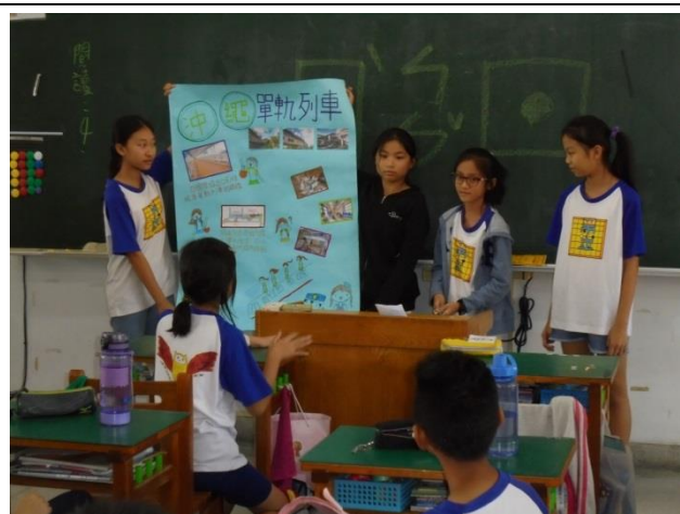
學生利用課堂時間進行上台練習