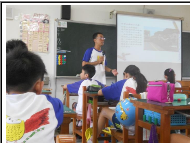
進行臺灣軌道發展歷史教學