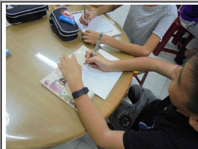
學生利用音樂課草擬進站音樂