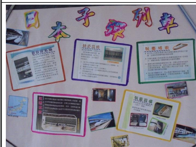
學生完成的海報成品