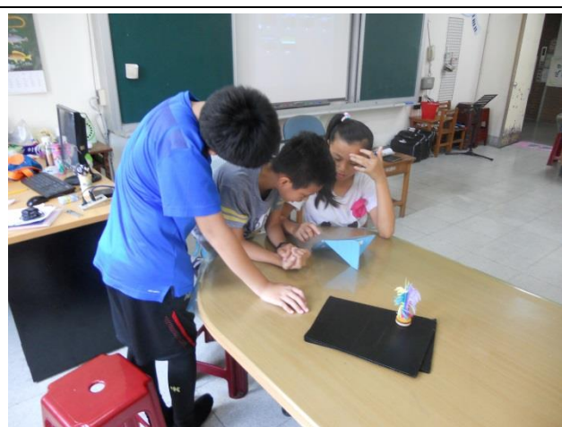
學生進行軟體操作體驗