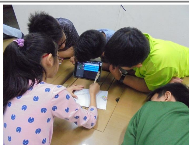
學生利用音樂軟體進行進站音樂創作