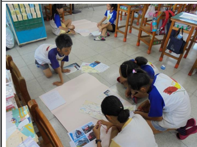
課堂間學生進行海報繪製