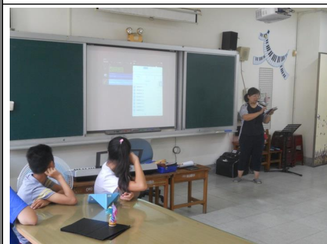
進行音樂創作軟體教學