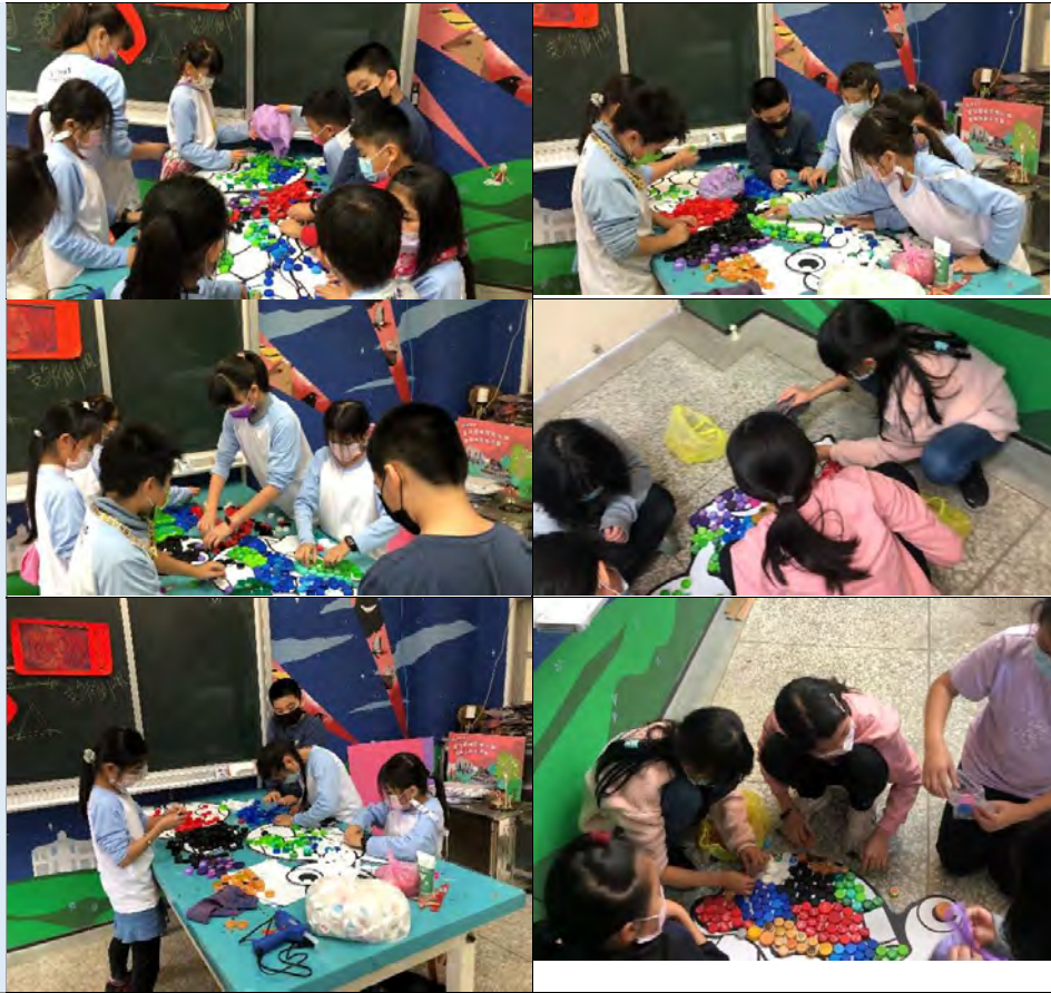
其他對於 計畫之建議