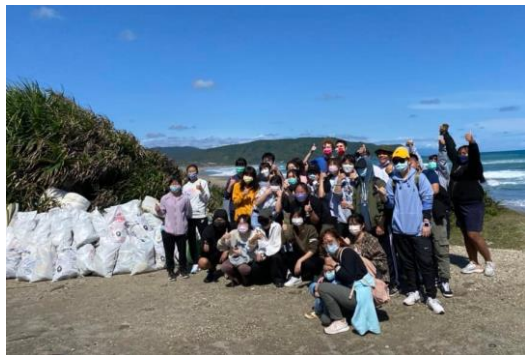
學生體驗服務學習課程 動手做樂趣多