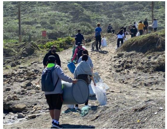
專注學習用心製作