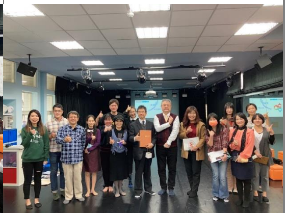
桃高團隊、大學教授、學科中心、臺灣應用劇場與觀課教師們合影