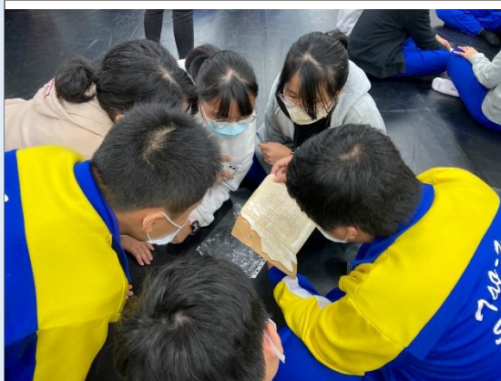
學生藉由物件，探詢與彙整事件資訊