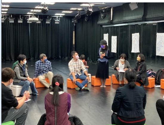
課程結束後，針對此跨域課程進行討論