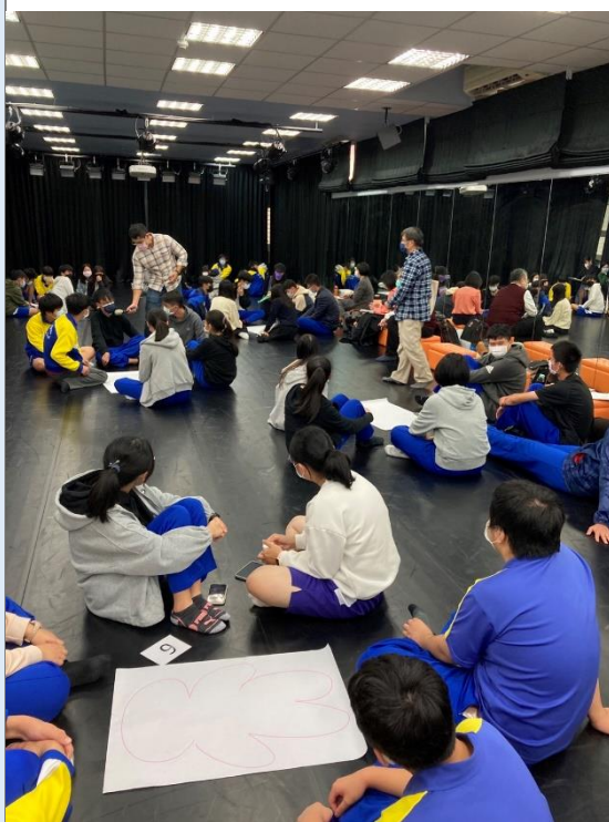
學生透過討論整理歷史事件人物的特質