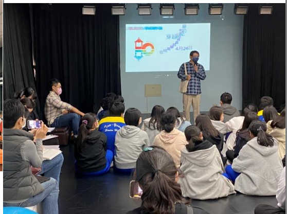
歷史老師敘述桃高故事，將學生帶入歷史情境