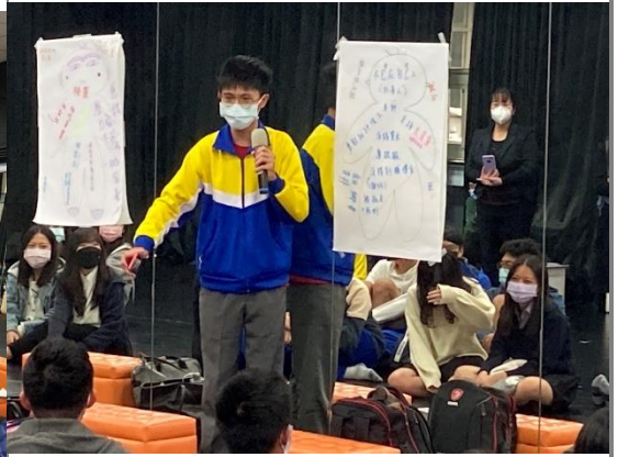
由學生來總結學習脈絡與課程重點