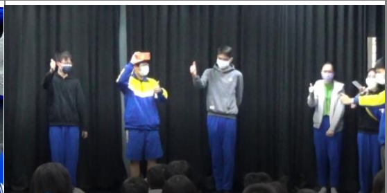
學生透過旁述默劇還原歷史原貌