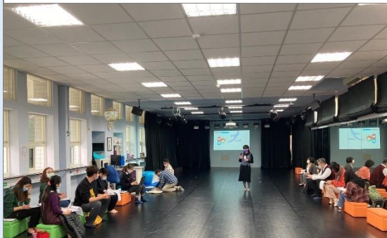
進行跨域課程設計理念、操作方式與期望目標