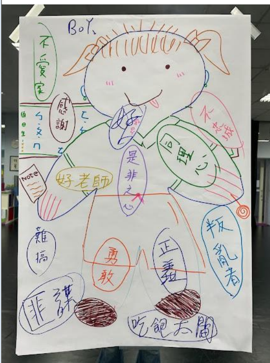
桃園市立桃園高級中等學校 公開觀課 6. 回饋表