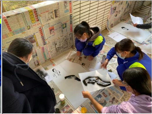
學生進行塗鴉創作