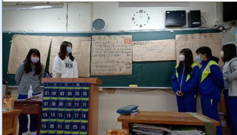
學生利用海報進行白色恐怖受害者個案報告