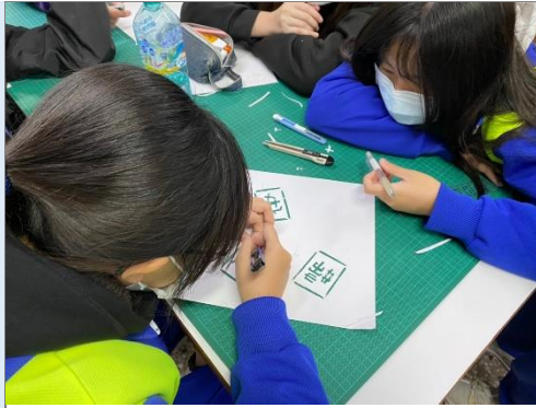
學生正在進行孔版製作