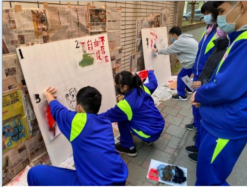
學生進行塗鴉創作