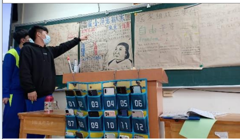
學生利用海報進行白色恐怖受害者個案報告