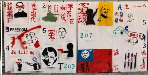
學生人權塗鴉作品成果