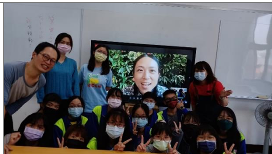
視訊會議結束後和導演進行「合照」