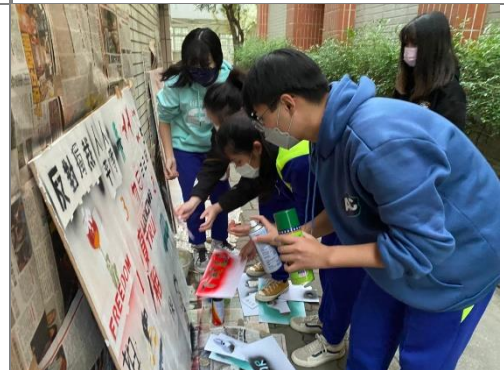
學生進行塗鴉創作