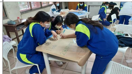
學生繪製白色恐怖受害者個案的說明海報