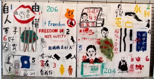
學生人權塗鴉作品成果