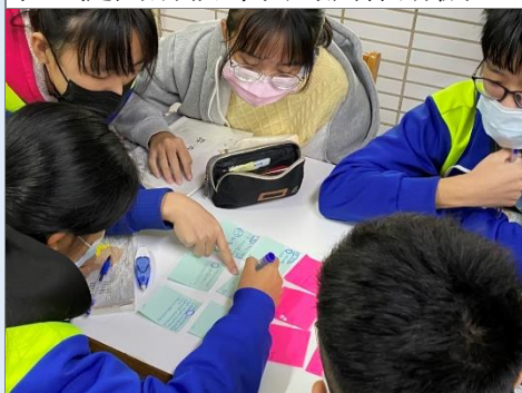
利用便利貼,請學生寫下人權關鍵字與感受