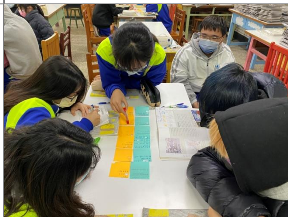
利用便利貼,請學生寫下人權關鍵字與感受,並且小組加以核對共同有感的部份。