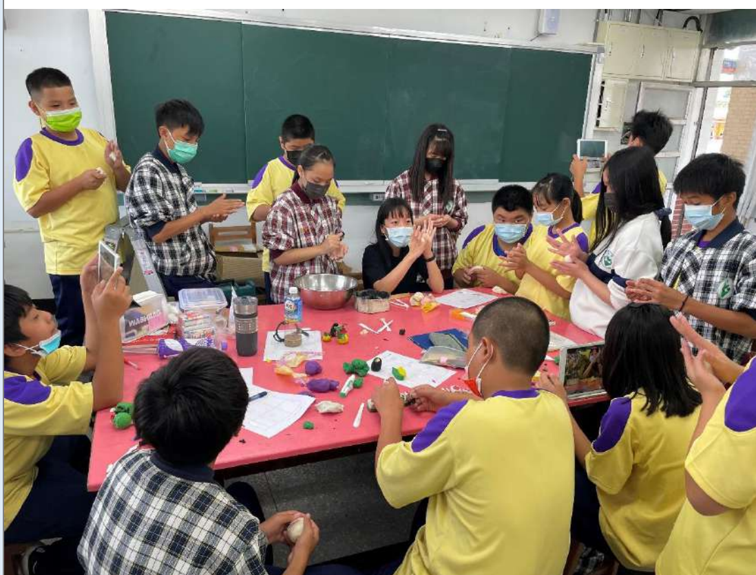
實際操作包餡手法與塑形技法，利用黏土練習基礎練切技巧。