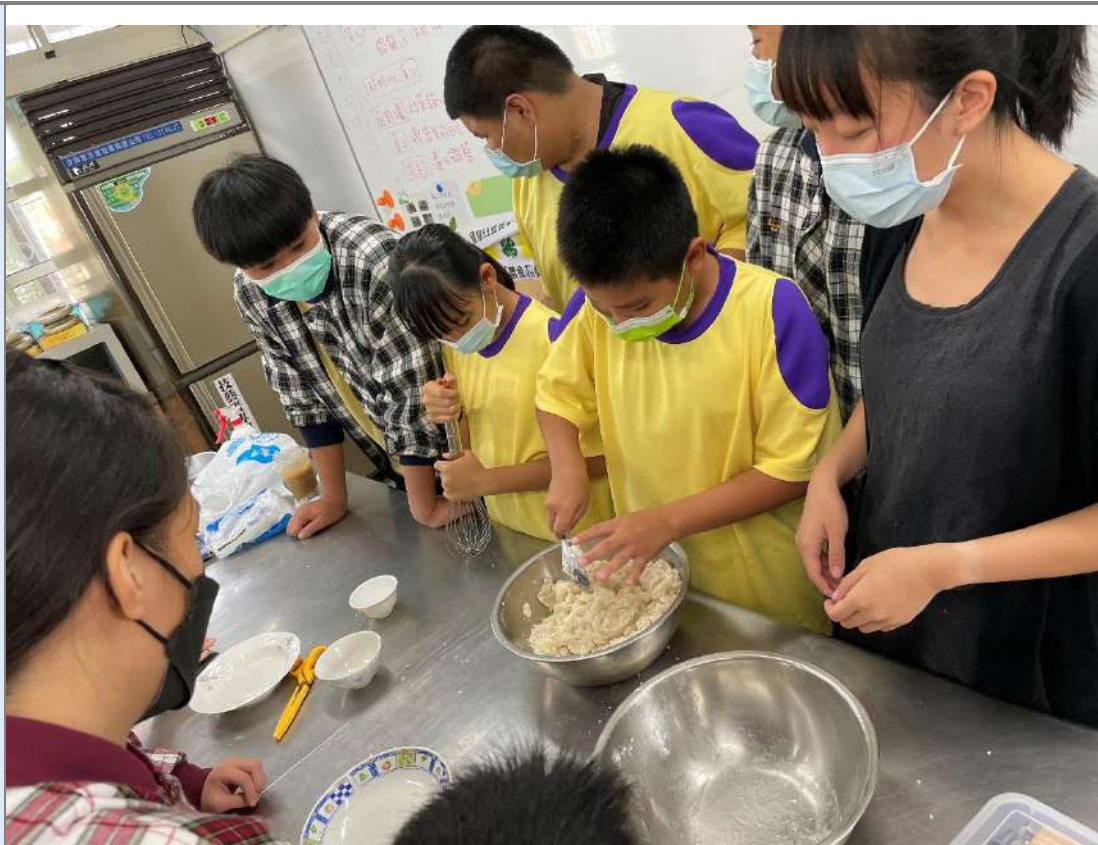
和菓子內外餡製作方式。