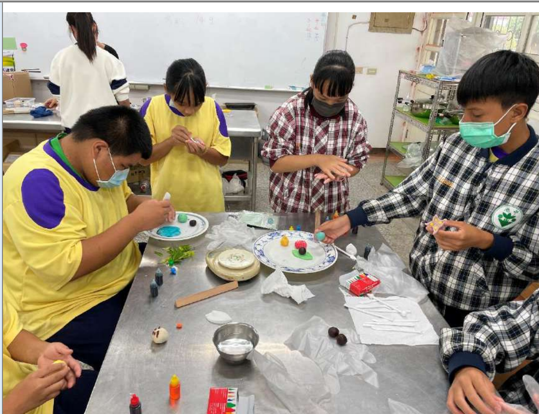
導入色彩學以食用色素實驗之。