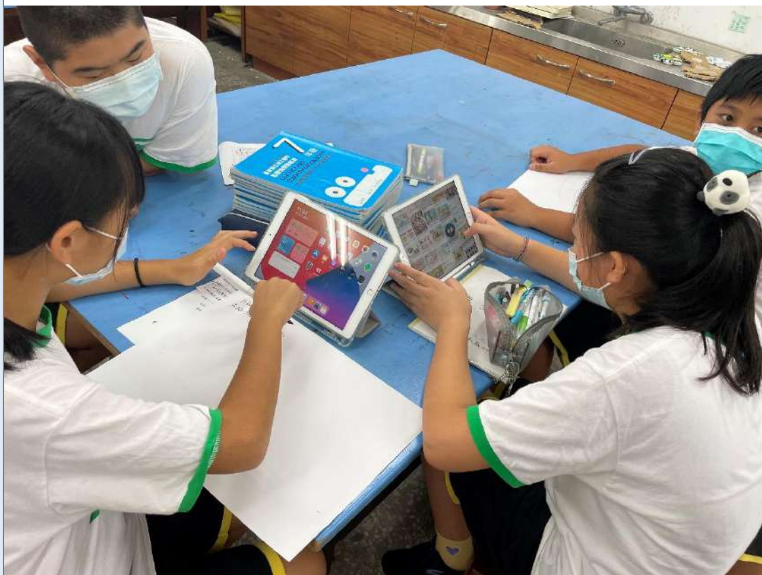
繪製和菓子創意草稿。