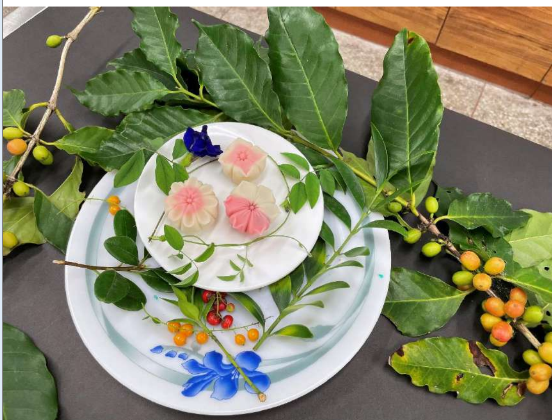
完成創作擺盤並發表。