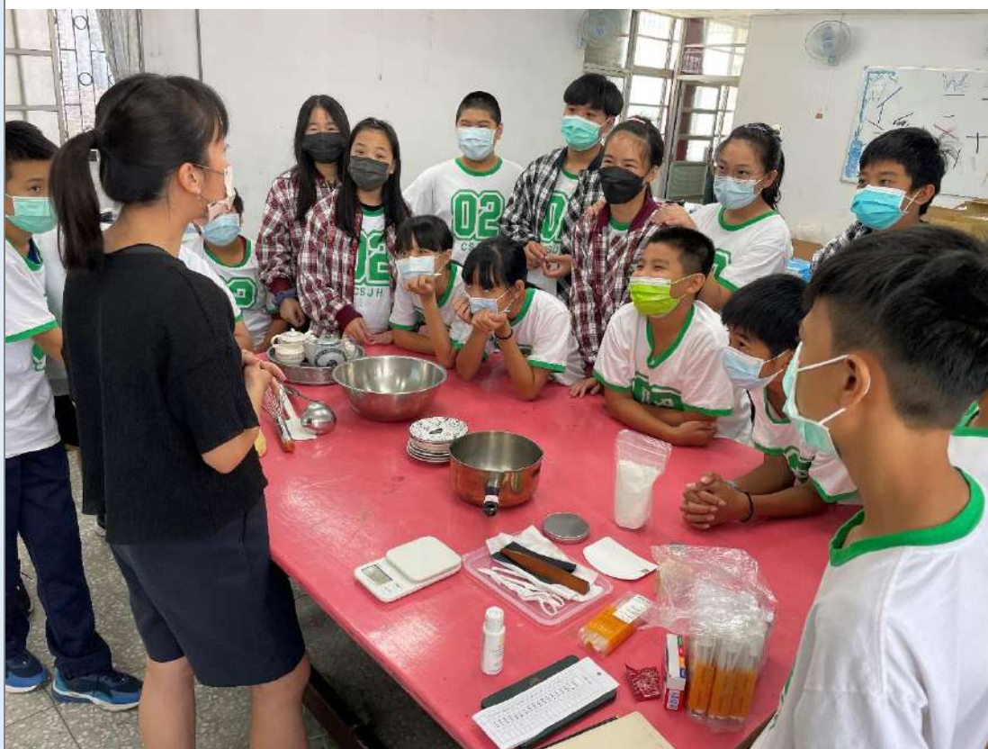
家政教室設備器材等使用方式與注意事項。