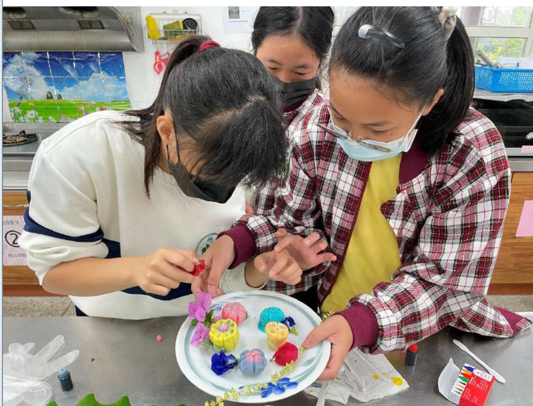
使用食材進行最終創作。