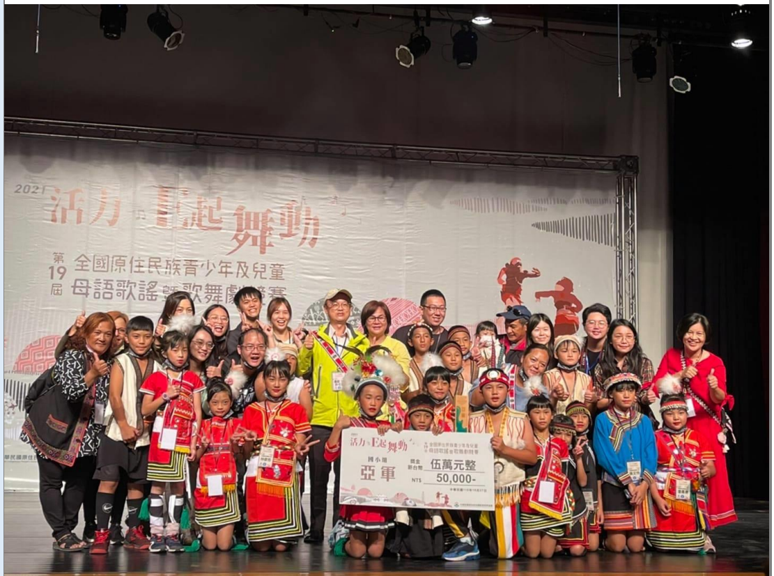
美麗的「緣夢」族語戲劇，傳遞長良地域性的族群共生共榮。