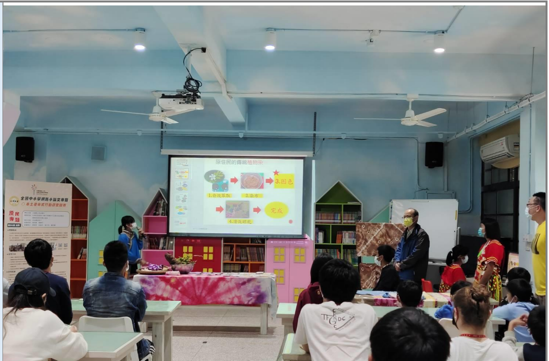
藉由台大國際學辦文化交流-請學生上台介紹原住民的植物染 天然媒染劑專題研究：「灰與灰的追逐」 (榮獲今年全國網路小論文原民專題類別第一名)