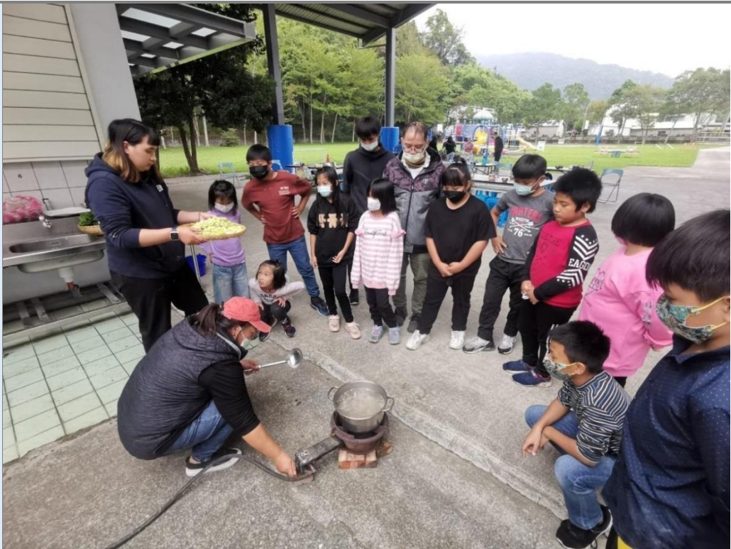
製作一道 Pakelang 慶豐收菜餚。