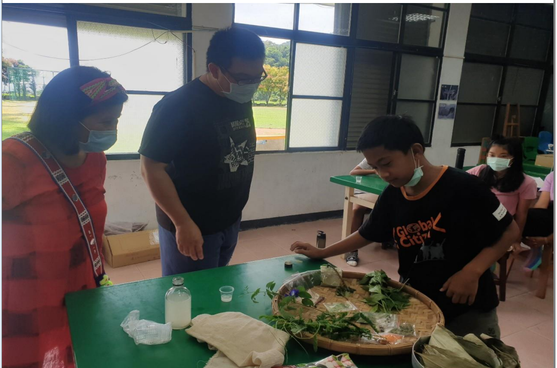
認識製作酒釀的原生植物

(大葉田香草、檳榔葉、毛柿葉、土柚、山素英、小黃菊、過山香、山澤蘭、紅九層塔、艾草、大風草、雞屎藤、紫蘇葉等…。