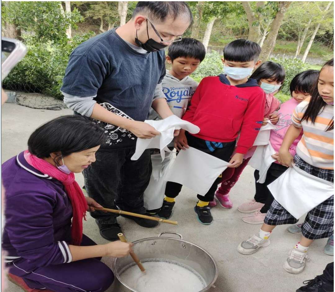
惠嫻老師在綜合課時引導學生將染布進行清洗，較容易染色。