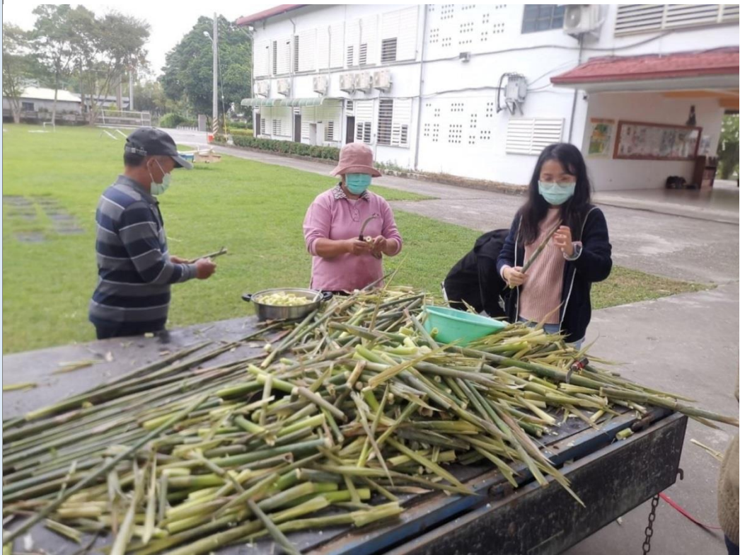
烹煮金多筍體驗及剝筍技巧。