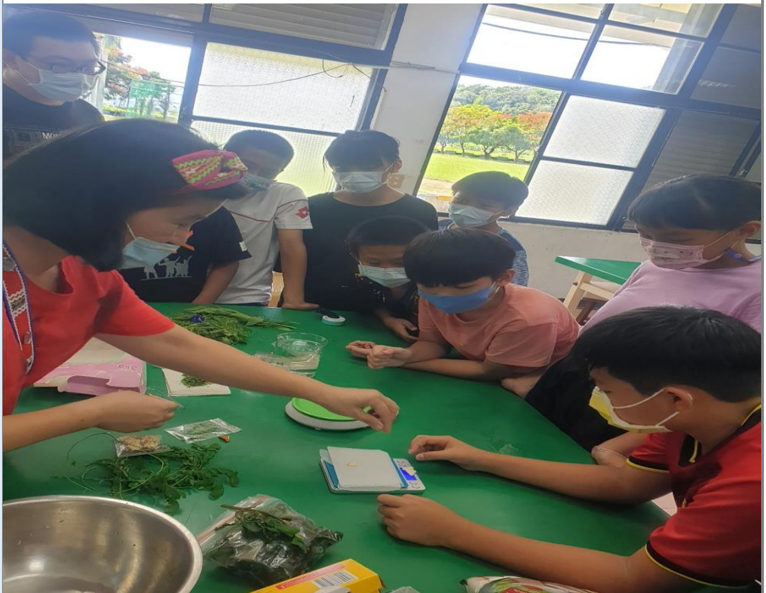
依照製作酒釀(植物)時所需要的比例

(大葉田香草、檳榔葉、毛柿葉、土柚、山素英、小黃菊、過山香、山澤蘭、紅九層塔、艾草、大風草、雞屎藤、紫蘇葉等…。