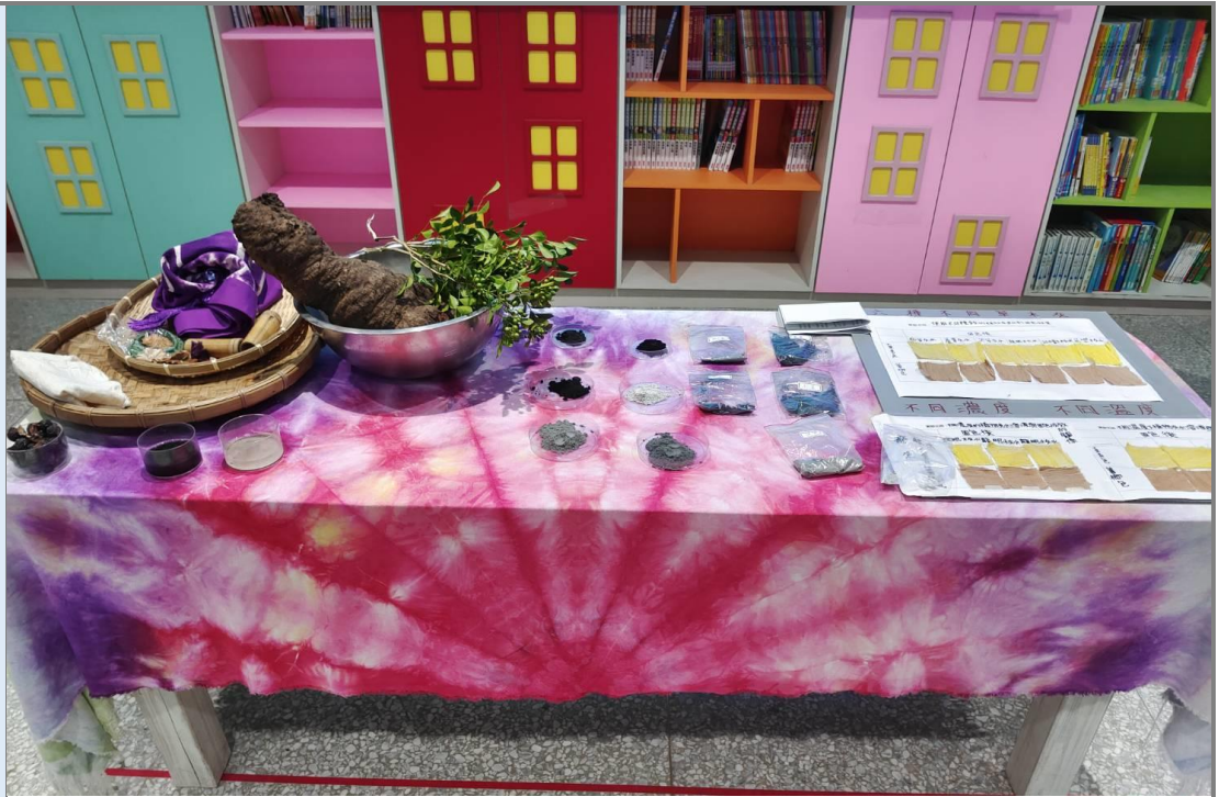
草木灰水對於植物染固色效果成果展