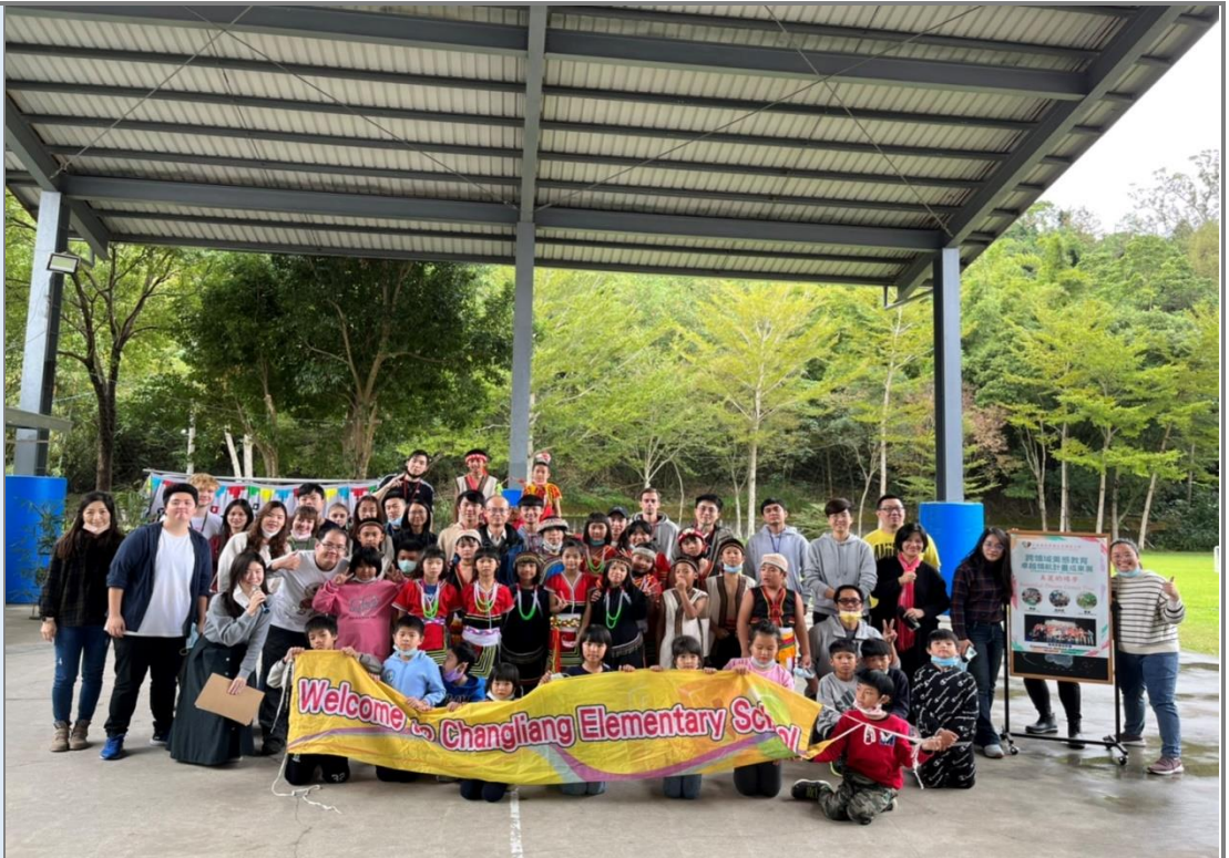
透過族語戲劇展演-與台大國際學伴進行交流。