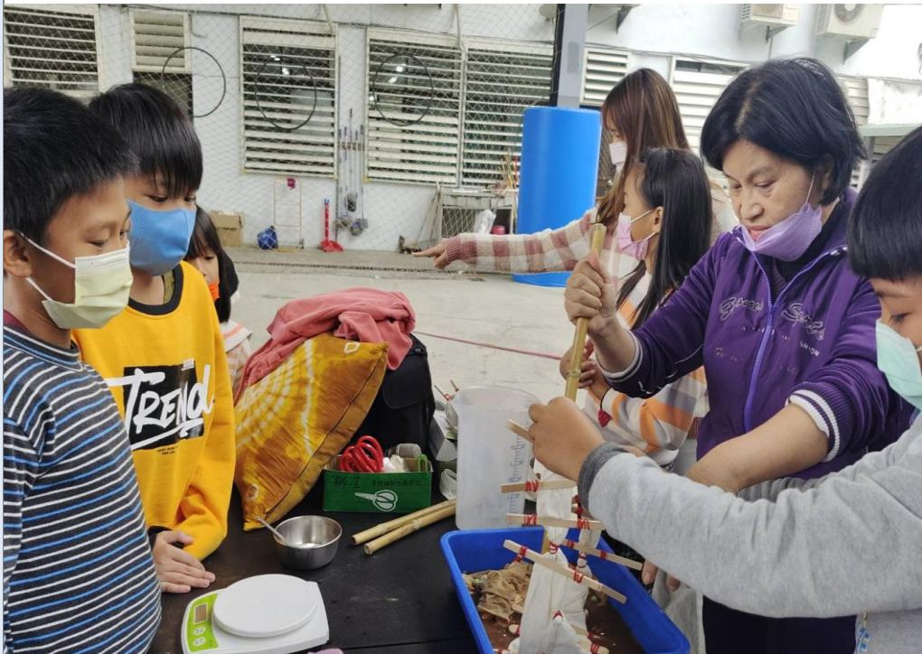
讓學生運用冰棒棍固定圖騰的造型。