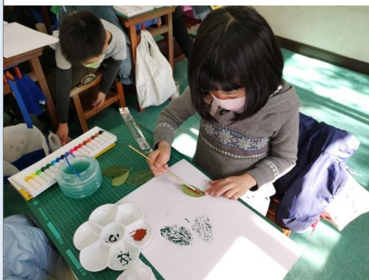
第一次使用水彩，學生都很努力