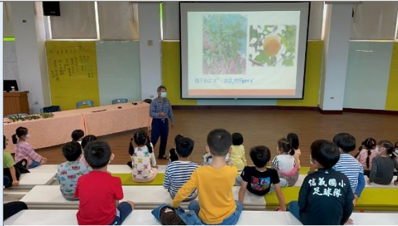
認識校園植物-阿勃勒的種子