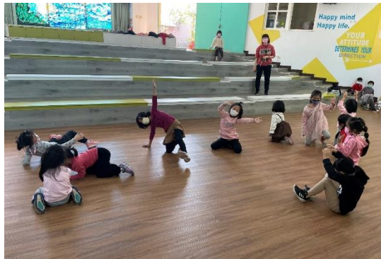
大家發揮團隊創意