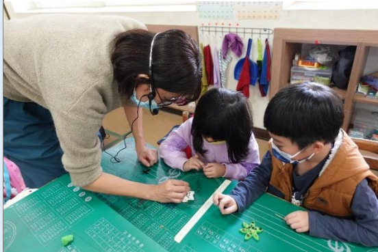
以簡報方式更深入的認識校園植物