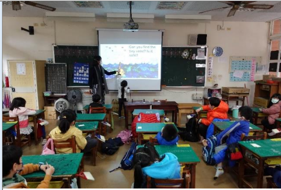
雙語融入進行跨域學習