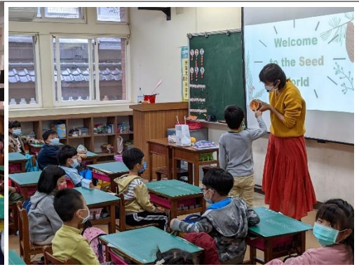
找尋種子在哪裡？學生聽得懂英文喔！