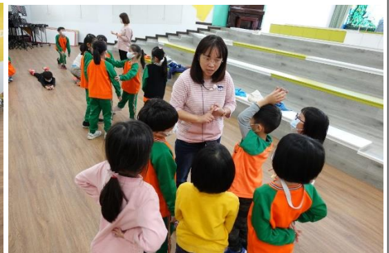
教師是最好的引導者