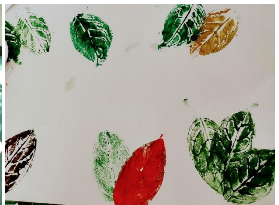
小孩子的創意不可小覷