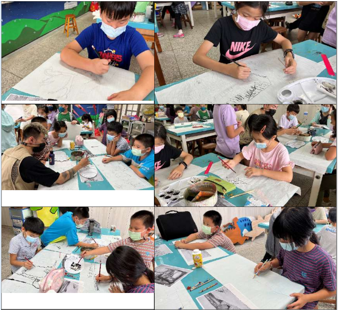
其他對於 計畫之建議