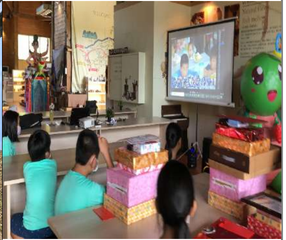
其他對於 計畫之建議