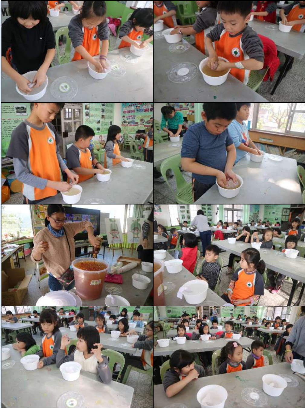
其他對於 計畫之建議