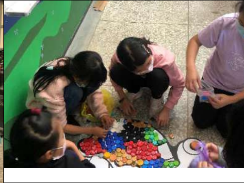
其他對於 計畫之建議