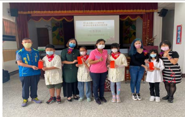
會長交接揚琴表演會長獎勵