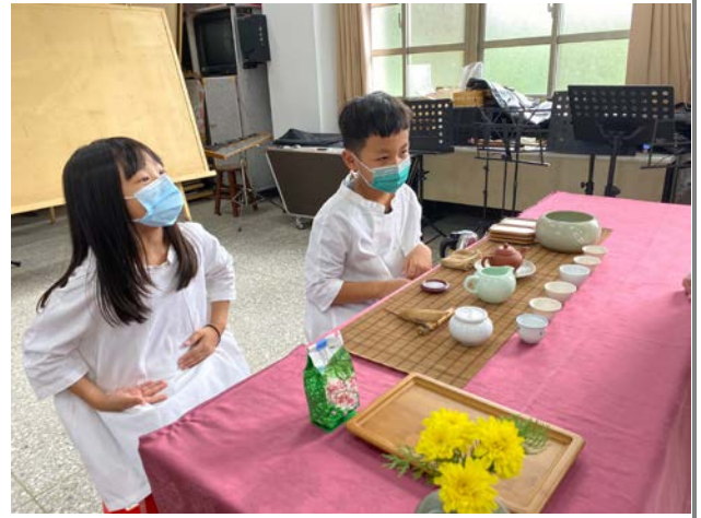
本校會長交接學生擔任接待---泡茶