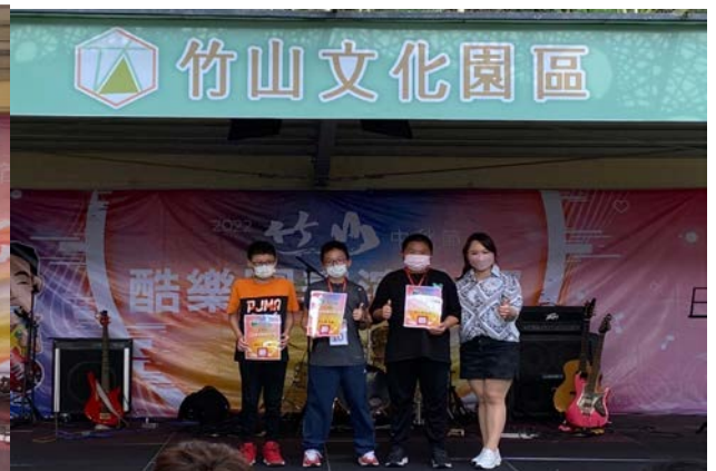
學生參加酷樂團表演比賽