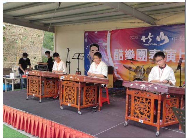
學生參加酷樂團表演比賽