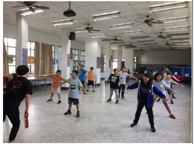
肢體伸展課程－舞蹈指導