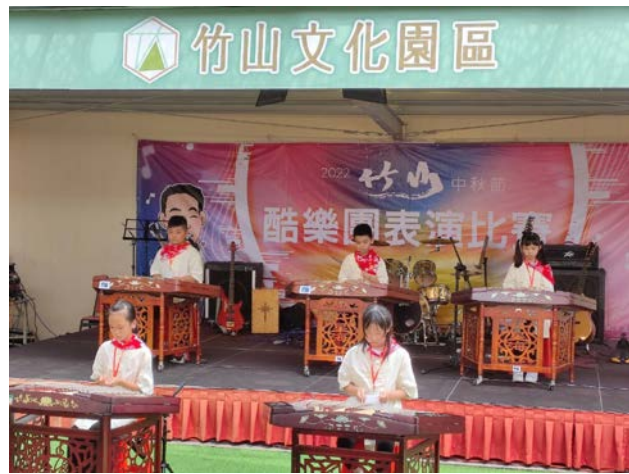
學生參加酷樂團表演比賽