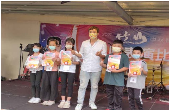
學生參加酷樂團表演比賽