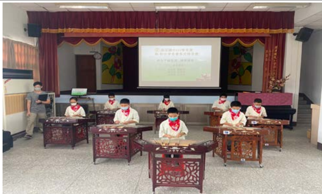
會長交接揚琴表演