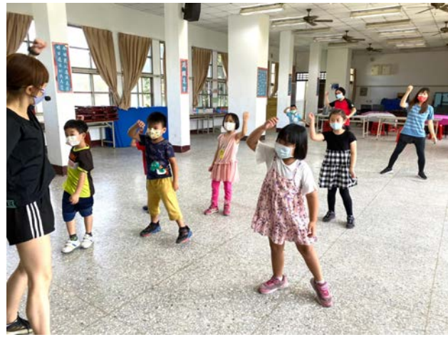
肢體伸展課程－舞蹈指導