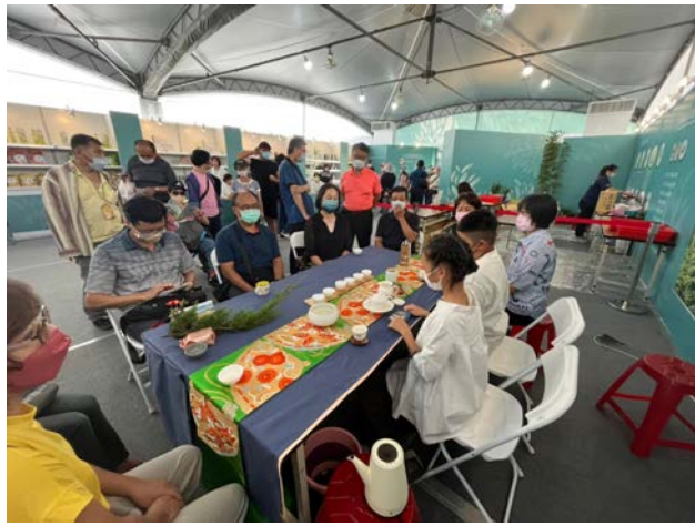
茶業博覽會支援泡茶