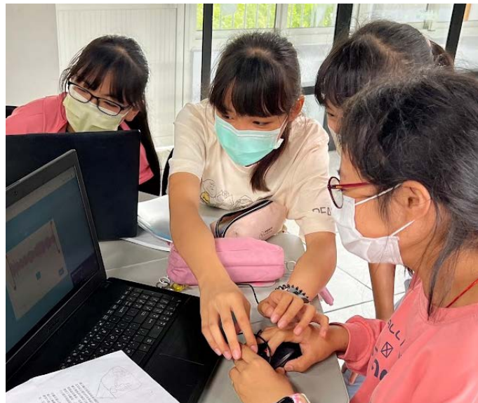
書法家故事 Scratch 動畫設計-程式撰寫