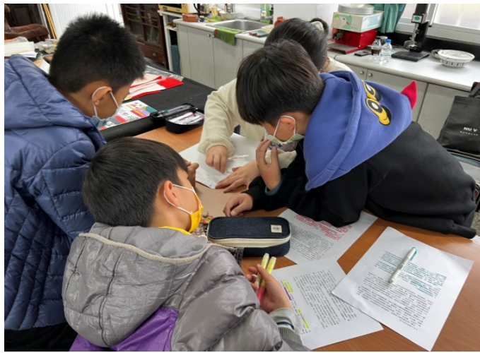
劇本文案設計 與討論