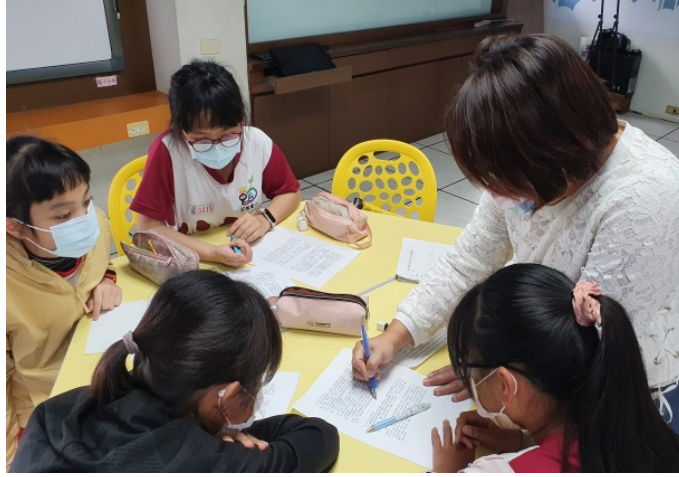
劇本文案設計 與討論