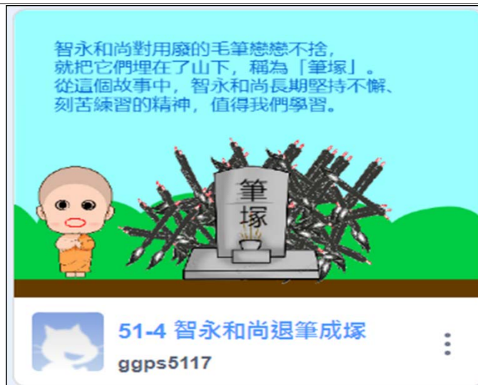
書法家故事 Scratch 動畫設計-作品