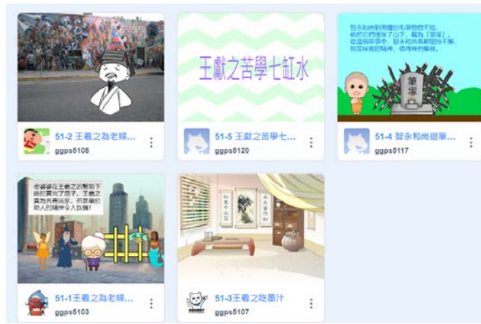
書法家故事 Scratch 動畫設計-作品