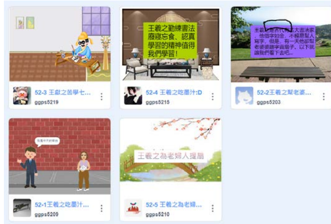
書法家故事 Scratch 動畫設計-作品