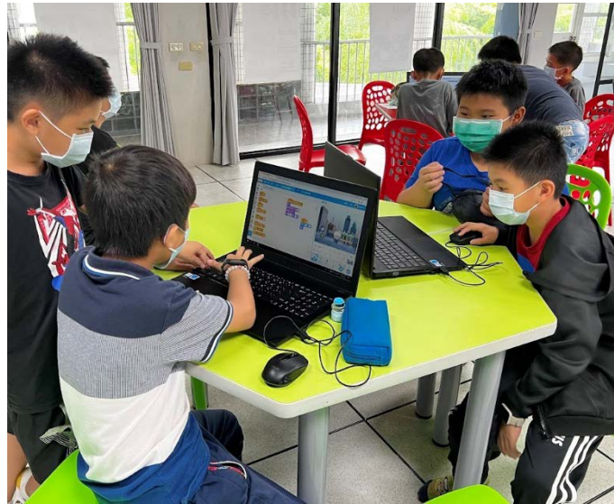
書法家故事 Scratch 動畫設計-程式撰寫