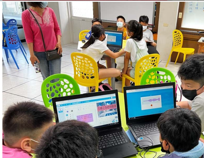
書法家故事 Scratch 動畫設計-程式撰寫