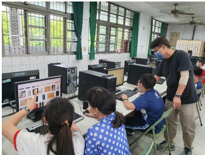
角色造型、背 景規劃