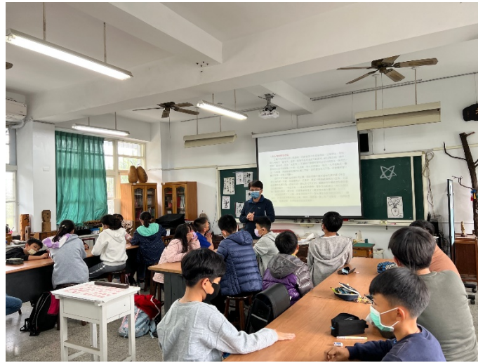
角色造型、背景規劃