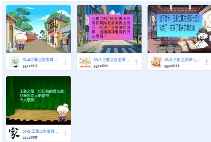
書法家故事 Scratch 動畫設計-作品