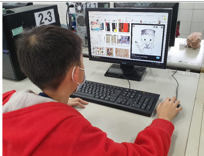
角色造型、背景規劃