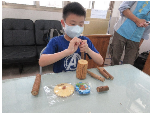
用樹枝素材進行美感作品創作(一)