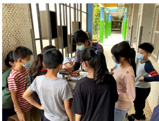
老師向學生介紹木工機具