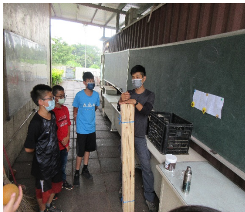
老師向學生介紹狗屋使用素材及製作原理