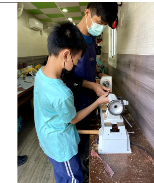
學生學習利用機具製作木工筆(一)