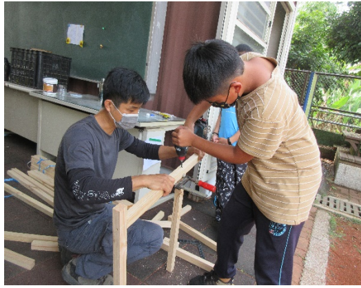
學生動手製作狗屋(一)