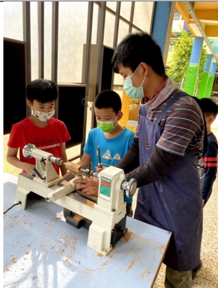
學生學習利用機具製作木工筆(二)