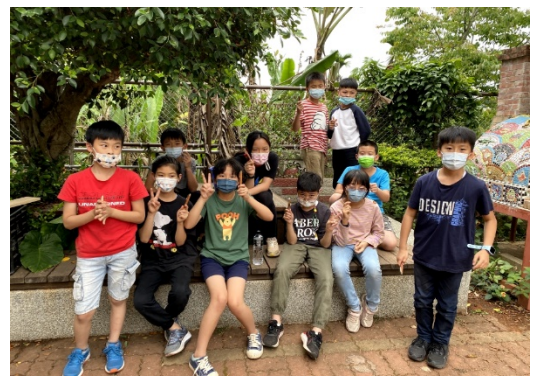
跟自己的木工筆合照吧!