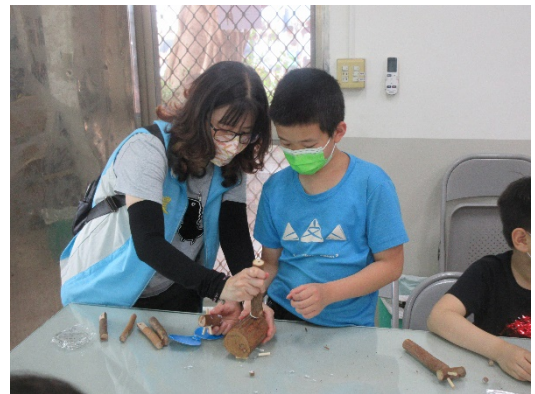
用樹枝素材進行美感作品創作(二)