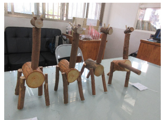
美感作品-樹枝長頸鹿完成囉!