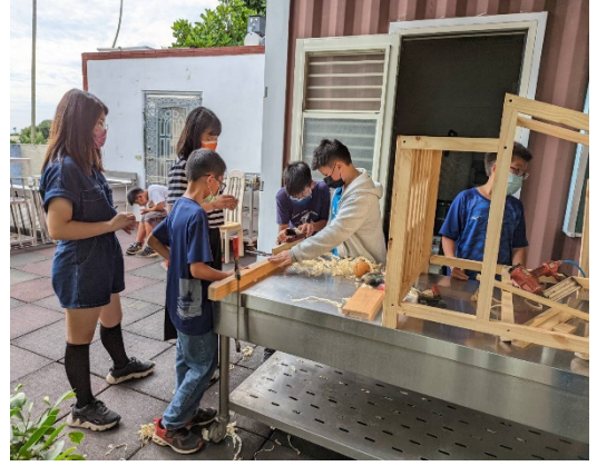
學生動手製作狗屋(二)