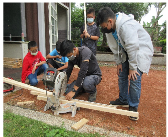
向學生介紹如何使用木工機具進行木材裁切