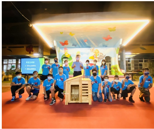
將完成的狗屋贈送給學校