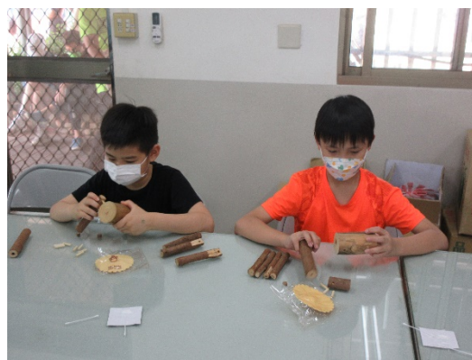
用樹枝素材進行美感作品創作(三)