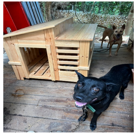
校犬與新家相見歡