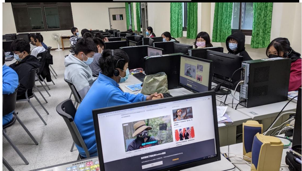
藝有所指創作【SDGs 議題小曲】