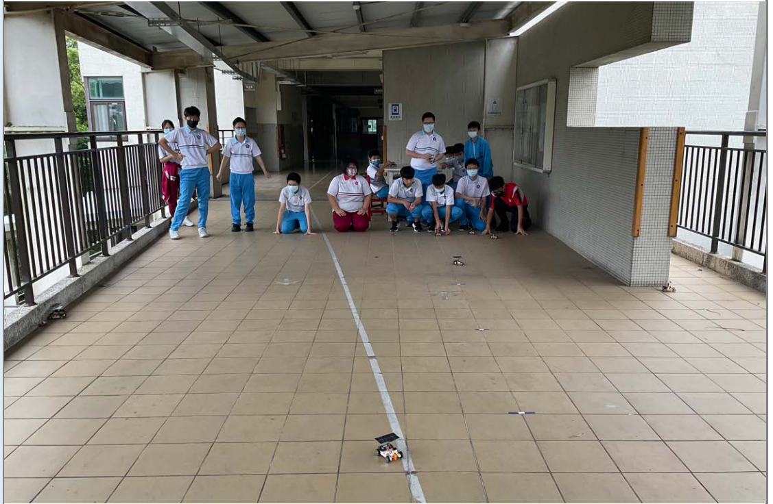
藝有所指創作【SDGs 影像紀錄】