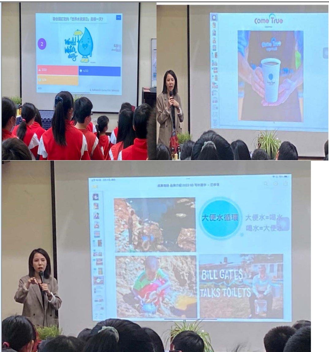
SDGs3 健康與福祉【青少年健康問題探討與行動改變】