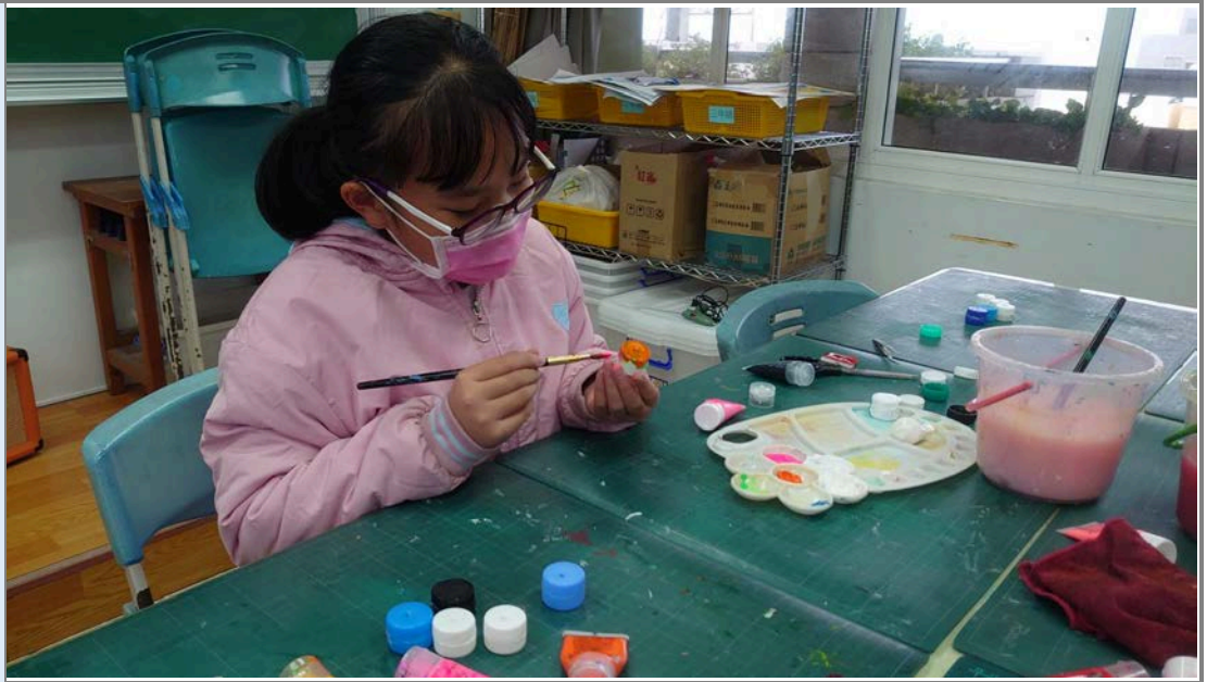
學生開始繪製瓶蓋