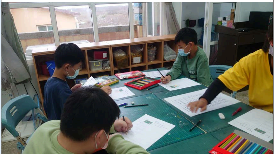
學生參考琉璃珠紋飾創作琉璃珠