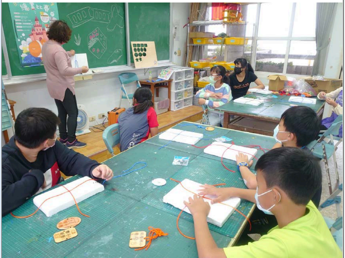
老師講解中國結編製技巧