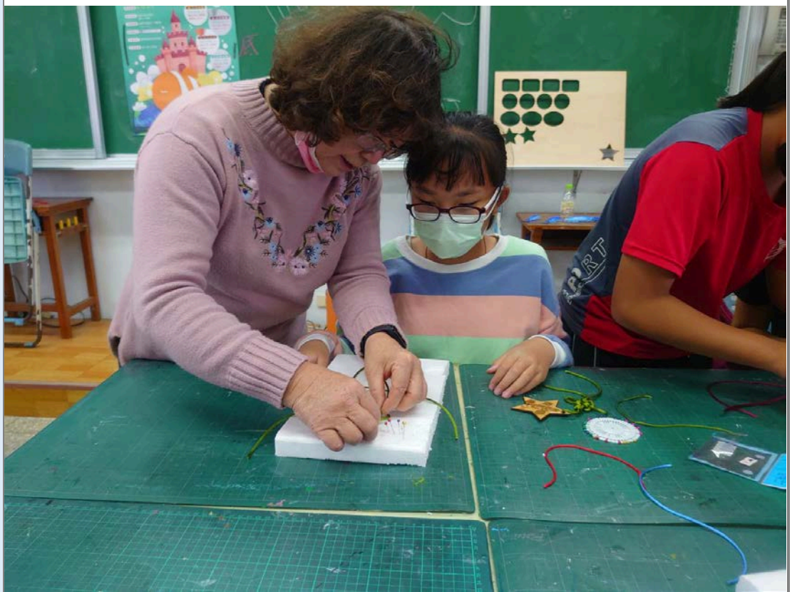
老師進行個別指導