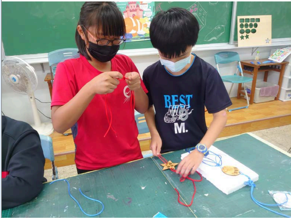
同儕之間彼此協助