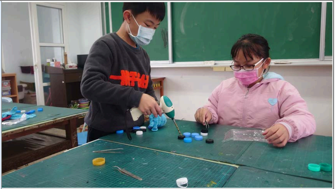
讓高年級學生在安全的狀況下使用簡單機械