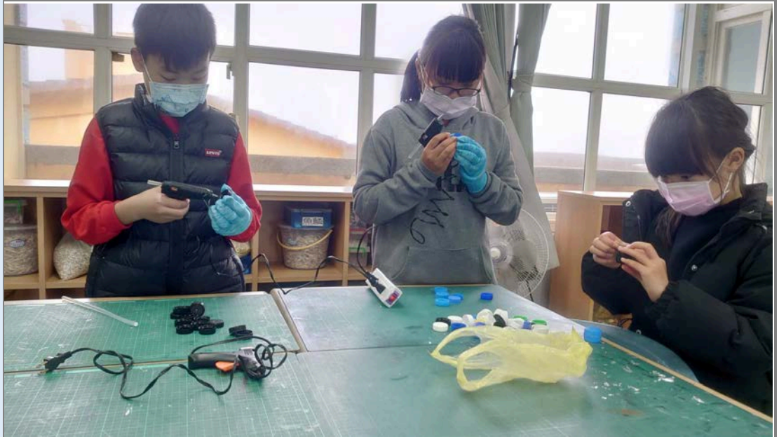
高年級學生使用熱熔膠將瓶蓋黏合