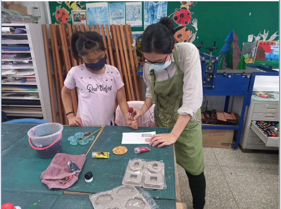
老師與學生依據設計圖進行討論