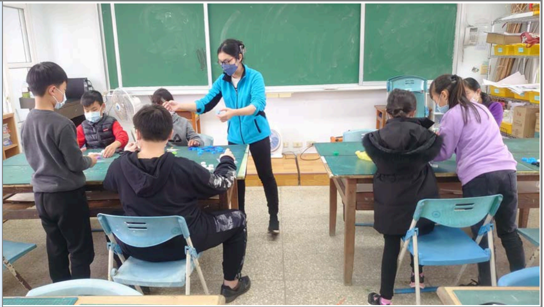
老師講解瓶蓋處理方式