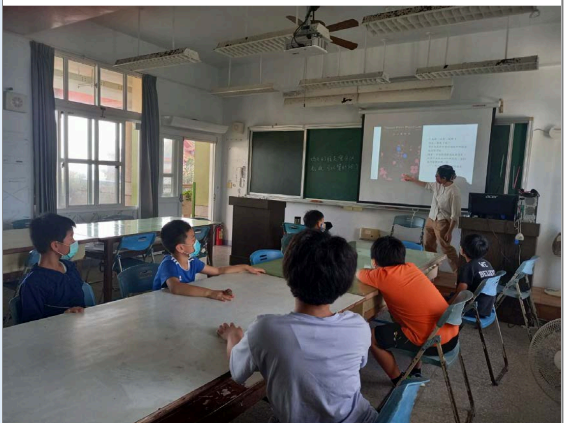
老師講解圖像元素對視覺的影響(搭配講解琉璃珠上的圖像意義)