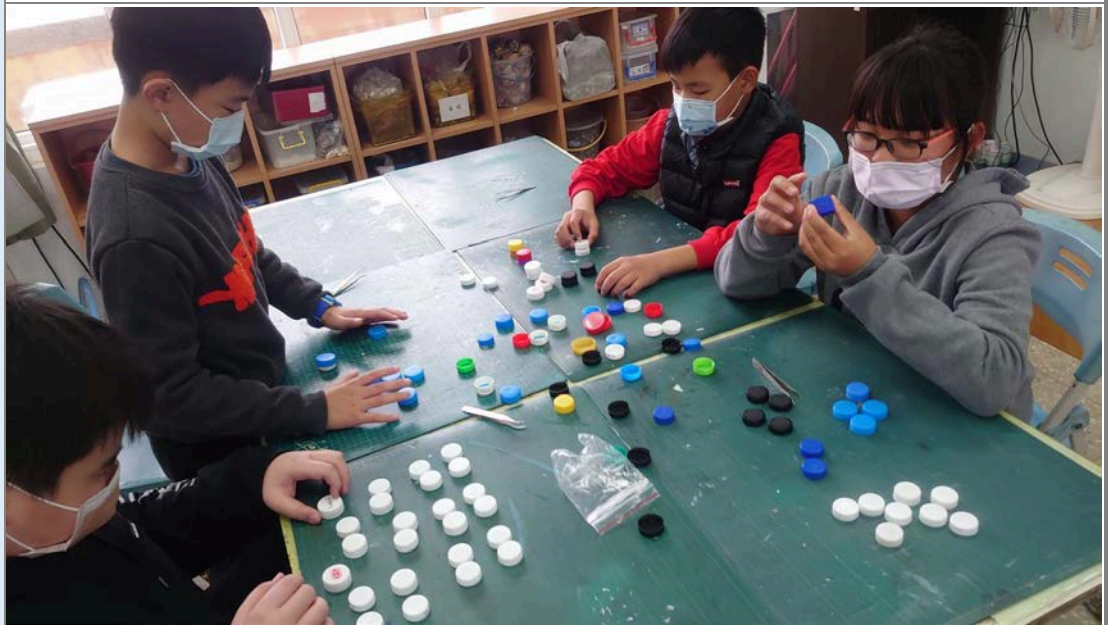
學生先將瓶蓋分類後始使用鑷子鑽孔