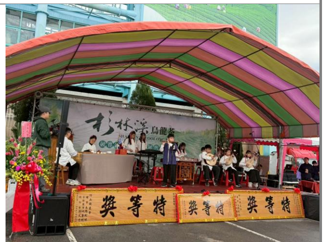
學生參加竹山農會冬茶展演活動開場表演