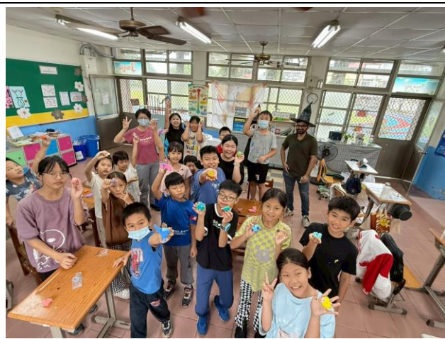
手作課程與舞蹈課程結合—創造自己小怪獸 道具製作