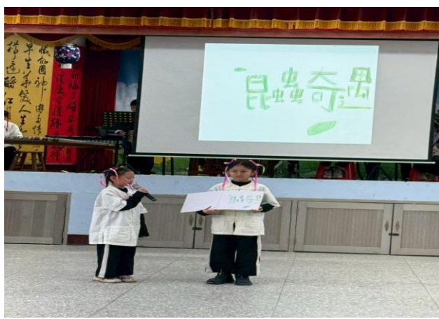
學生故事小書發表