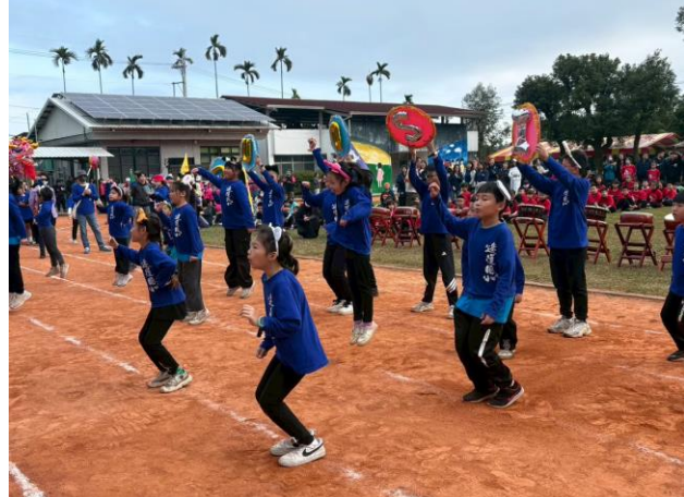
肢體伸展課程—七校聯運舞蹈表演