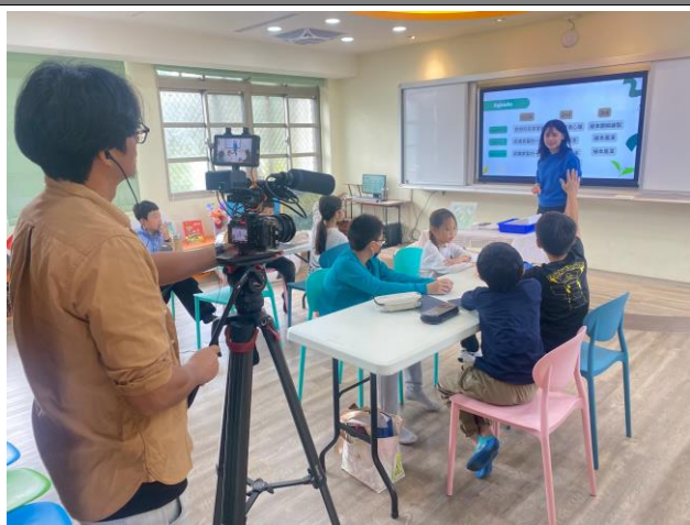
故事小書創作指導