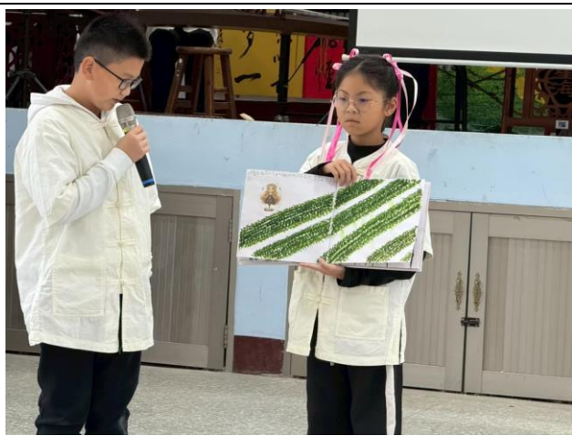
學生故事小書發表