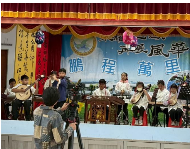
學生絲竹樂表演活動