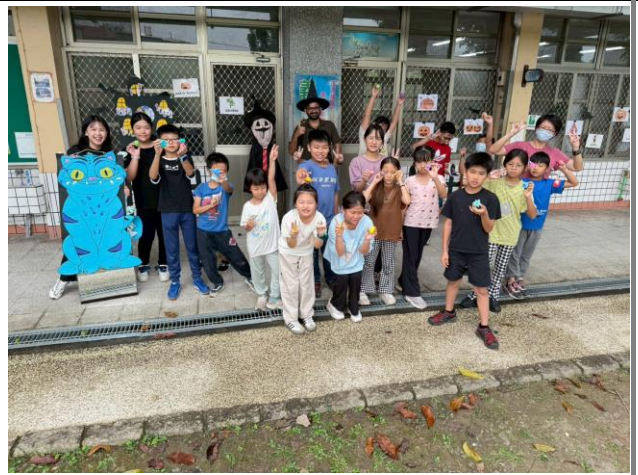
肢體伸展課程—創造自己的小怪獸